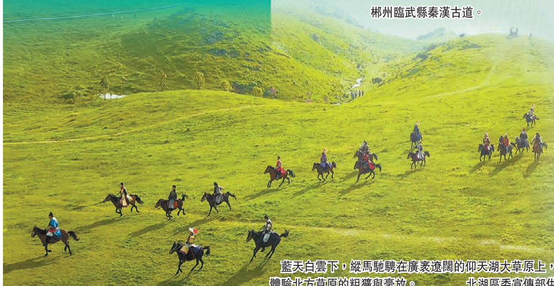
藍天白雲下，縱馬馳騁在廣袤遼闊的仰天湖大草原上，體驗北方草原的粗獷與豪放。北湖區委宣傳部供

山水畫卷，郴州相見。第二屆湖南旅遊發展大會即將啓幕，郴州期待四海賓朋來一趟「郴心之旅」，在這裏感受三湘四水的美好奇遇。