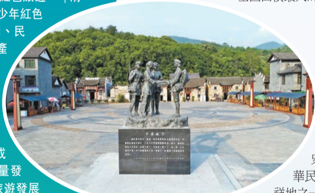
「半條被子」的故事溫暖中國。桂陽縣地處湘南粵北兩地。

飛天山，並非只是指一座山，而是由一泉、兩江、三廟及4坦、9寨和48谷等眾多景點組成的一大片丹霞地貌風景區，總面積約110平方公里，是全國面積最大的丹霞地貌區。