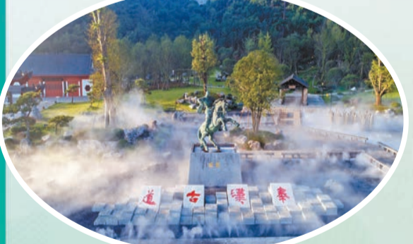
郴州臨武縣秦漢古道。

文旅要融合，沒有人文是不行的。郴州是湖南首批歷史文化名城，是中華民族農耕文化的發祥地之一，文化璀璨，熠熠生輝。