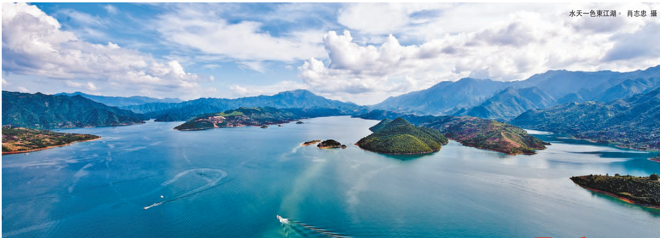
水天一色東江湖。