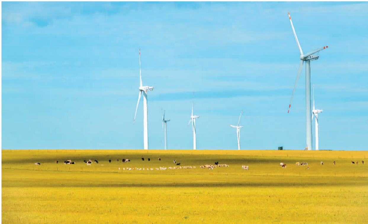
内蒙古自治区呼伦贝尔市近年立足光热资源丰富的优势，充分发挥“光伏+牧业”复合叠加效益，科学推进绿色新能源项目建设，助力边疆振兴。图为—排排风力发电机矗立在呼伦贝尔市陈巴尔虎旗美丽的草原上。

互利共赢。萨格尔表示，不断巩固中阿全面战略伙伴关系，是阿联酋坚定不移的政治意愿。感谢中国支持阿联酋加入金砖国家合作机制。明年是中阿建交40周年，愿不断增进双方在经贸、投资、立法、人文等各领域合作。