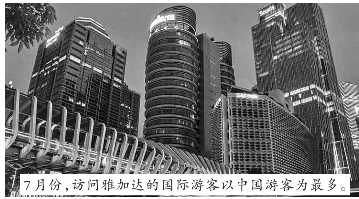
7月份,访问雅加达的国际游客以中国游客为最多。

为14,015人;排在第四位的是新加坡共13,228人次,日本为10,779人次。排在第七位的是韩国游客为9,641人次,美国有8,492人次,印度有6,228人次,澳大利