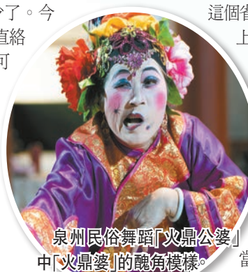
泉州民俗舞蹈「火鼎公婆」的醜角模樣。

跟着一支琵琶與一根洞簫前行，你會走向哪裏？一支是《風打梨》，一支是《梅花操》，你痴迷了方向沒有？說這是傳統音樂的「活化石」，你沿路走到哪個朝代，才坐下？我走到的是唐朝，據說那是發源地；但我更在意的，是那裏有李杜。李白與杜甫飲酒以後，以及吟