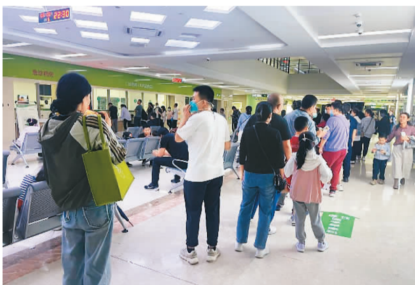
9月2日晚，来医院就诊的患者在排队。

2022年9月，宁夏回族自治区记录一起雷暴哮喘事件。分析显示，14岁至40岁之间发病人数最多，常见症状包括喘息、气急、咳嗽及胸闷。