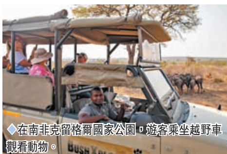
◆在南非克留格爾國家公園，遊客乘坐越野車觀看動物。

園中一望無際的曠野上，分布着眾多的大象、獅子、犀牛、羚羊、長頸鹿、野水牛、斑馬、鱷魚、河馬、豹、獵豹、牛羚、黑斑羚、鳥類等異獸珍禽。植物方面有非洲獨特的、高大的猴麵包樹。每年6月至9月的旱季是入園觀覽旅行的最好季節，年均遊客25萬以上。公園總部設在斯庫庫扎。遊覽克留格爾國家公園，遊客可以乘坐公園的觀光敞篷車，車輛根據觀光需要設計，越野性能較好，觀察視野開闊，司機經驗豐富並可協助遊客尋找動物，可以根據需要進入道路以外的區域。因此，敞篷車往往會先於其他車輛看到野生動物，對於觀察能力不強的遊客來說，跟隨敞篷車一起觀光也是不錯的選擇。