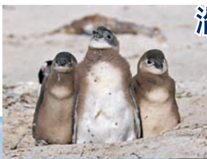
◆在南非西蒙鎮的博爾德斯海灘上的非洲企鵝。