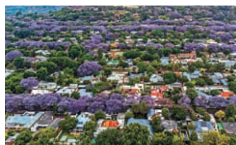
◆每年10月，約翰內斯堡藍花楸盛開。