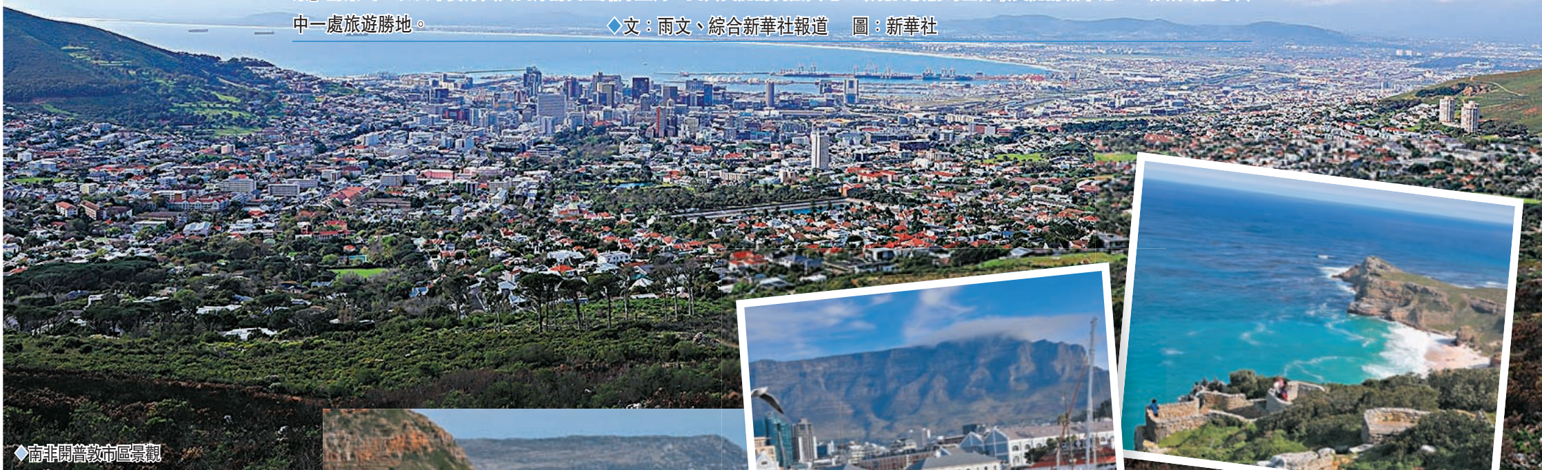
◆南非開普敦市區景觀