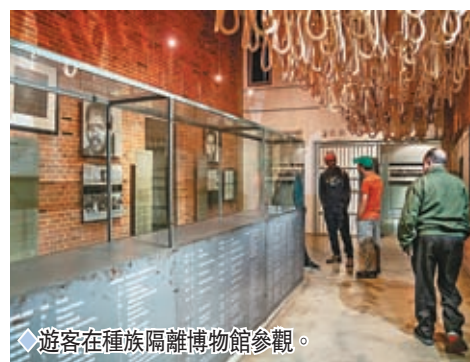
◆遊客在種族隔離博物館參觀。