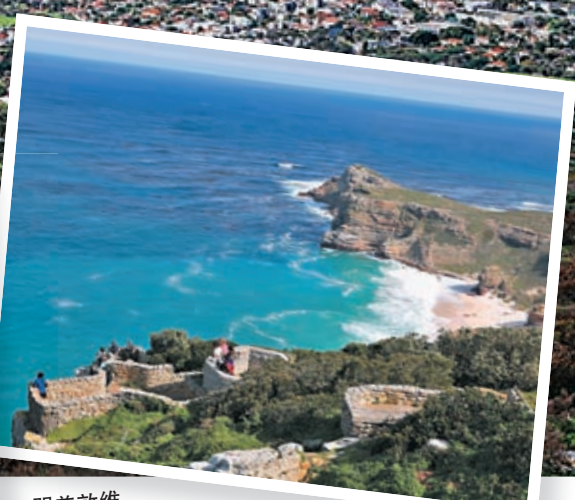
◆開普敦維多利亞港與桌山景觀