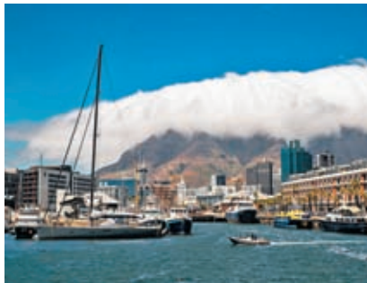
◆遊客在開普敦的一處海濱碼頭遊覽。