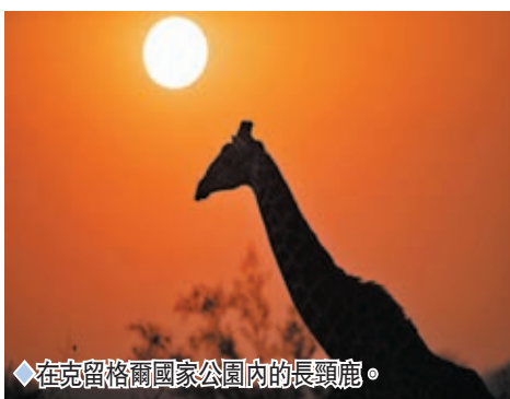
◆在克留格爾國家公園內的長頸鹿。