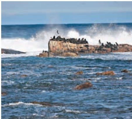
▲▲在開普敦好望角景區拍攝的景色