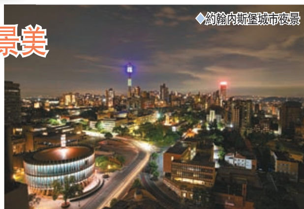
◆約翰內斯堡城市夜景

而且，約翰內斯堡城市夜景優美，當中位於約翰內斯堡西南角的種族隔離博物館，於2001年建成並向公眾開放，館內展示有文字、圖片、視頻和實物，並以豐富的史料和實物揭露了南非種族隔離時期的黑暗，同時也展示了南非結束種族隔離政策12年以來，這個曾經推行臭名昭著的種族隔離制度的國家如何從「黑白分明」發展成一個「彩虹國度」。