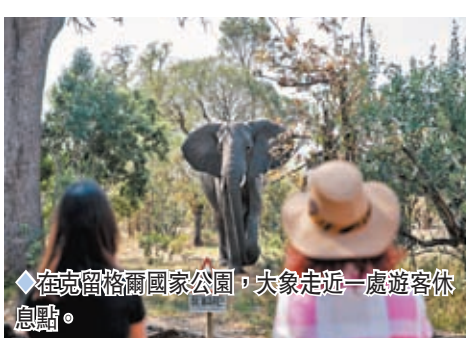
◆在克留格爾國家公園，大象走近一處遊客休息點。