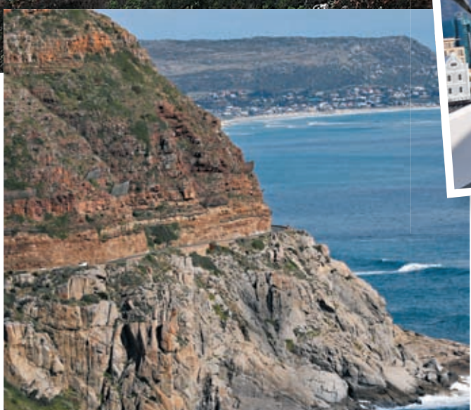
◆開普敦查普曼峰公路

而好望角，北距開普敦48公里，瀕大西洋，在開普半島的盡頭處。在蘇伊士運河未開通以前，好望角是歐洲通往東方的海路必經之地；至今，特大油輪若無法進入蘇伊士運河，仍需繞行好望角。好望角常被誤認是非洲大陸最南端，而距離其東南偏東方向約150公里、隔佛爾斯灣而望的厄加勒斯角才是實至名歸的非洲最南端。