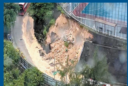
紅磡佛光街足球場附近發生山泥傾瀉，泥土佔據附近一段行車線。