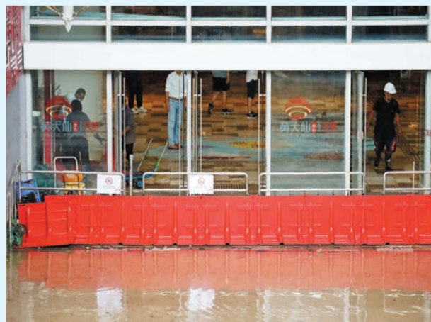
黃大仙中心北館正在搶修，昨日黃雨下一度再遇水浸。

另一方面，港鐵表示，黃大仙地鐵站D1出入口外因路面水位較高，已關閉並裝上擋水板；部分設備因水浸損壞而復修需時，B3出入口仍須關閉。預計排隊出入關及候車時間可能較長，站內升降機及扶手電梯亦繼續暫停使用，有需要乘客可使用樂富或鑽石山站乘搭觀塘線。