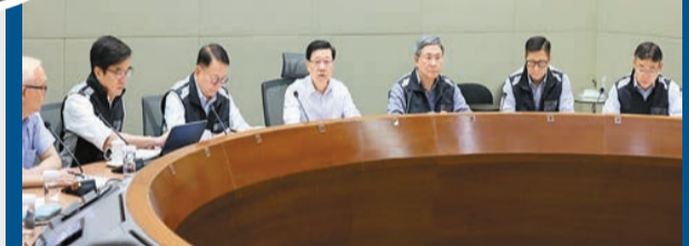
特首李家超昨午召開會議，聽取政府官員匯報各部門工作和市面復修情況，強調要把市民日常生活的不便減至最少。

陳國基表示，近日的特大暴雨造成廣泛地區水浸和山泥傾瀉，多區都出現極端情況。他說本港現時整體已回復基本正常運作，並稱今日上學或上班沒有問題；至於個別學校因善後清理工作需要，暫時未能恢復面授安排，教育局會保持跟進，提供適切支援。他又稱，運輸署將啟動緊急事故交通協調中心，監測全港交通及公共運輸服務的情況，並會與營辦商及相關