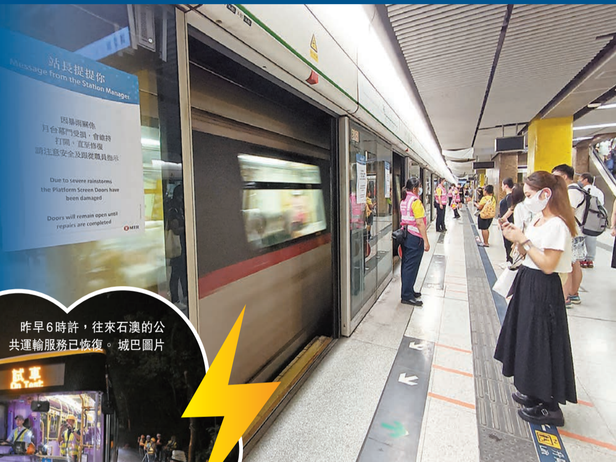
昨早6時許，往來石澳的公共運輸服務已恢復。

【香港商報訊】記者林駿強報道：受「海葵」颱風殘餘環流和季風影響，本港日前遭遇世紀暴雨，多區出現嚴重水浸，造成大面積破壞，特區政府連日展開全方位應對和善後工作。昨日，行政長官李家超召開會議，聽取一眾官員匯報市面復修情況、工作安排部署等。他表示各部門必須爭分奪秒，讓市面恢復正常運作，並感謝團隊及公務員同事全力一致、通力合作。當天下午，政務司司長陳國基於跨部門記者會表示，經過各部門積極努力，整體已回復基本運作，並說今日上班、上學大致沒有問題。