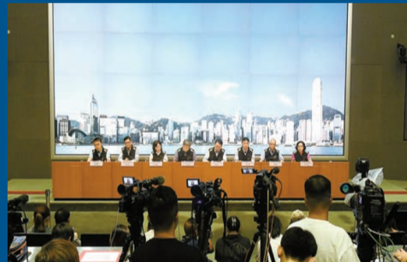
特區政府昨午召開跨部門聯合記者會，簡報市面復修情況。