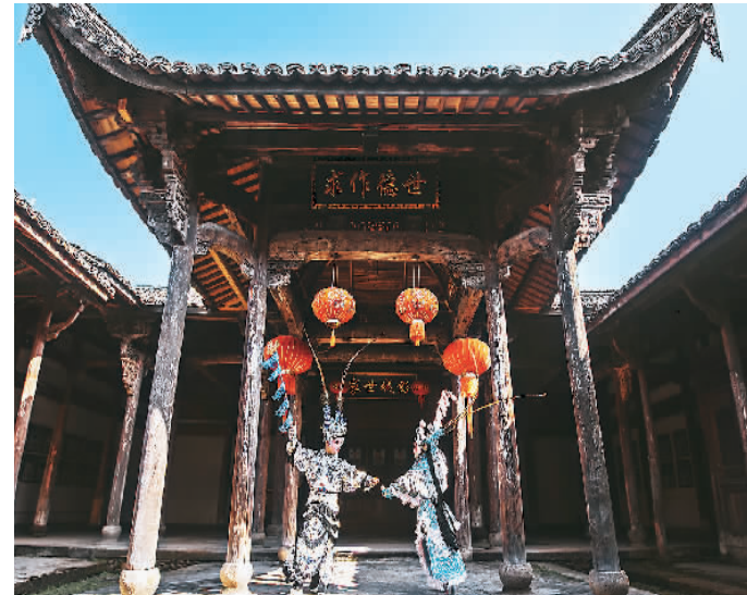
松阳高腔演出剧照。

文化古城、青春古城的多彩风姿。赏美景、观风物、话茶事、品佳茗、丝竹管弦为伴，高腔悠悠声传，在青山绿水间，在文化遗址中，在老街村巷里，呈现每一次“遇见”的惊喜和新意，实现对松阳古城山水风情、民俗文化、戏曲非遗的全方位推介。