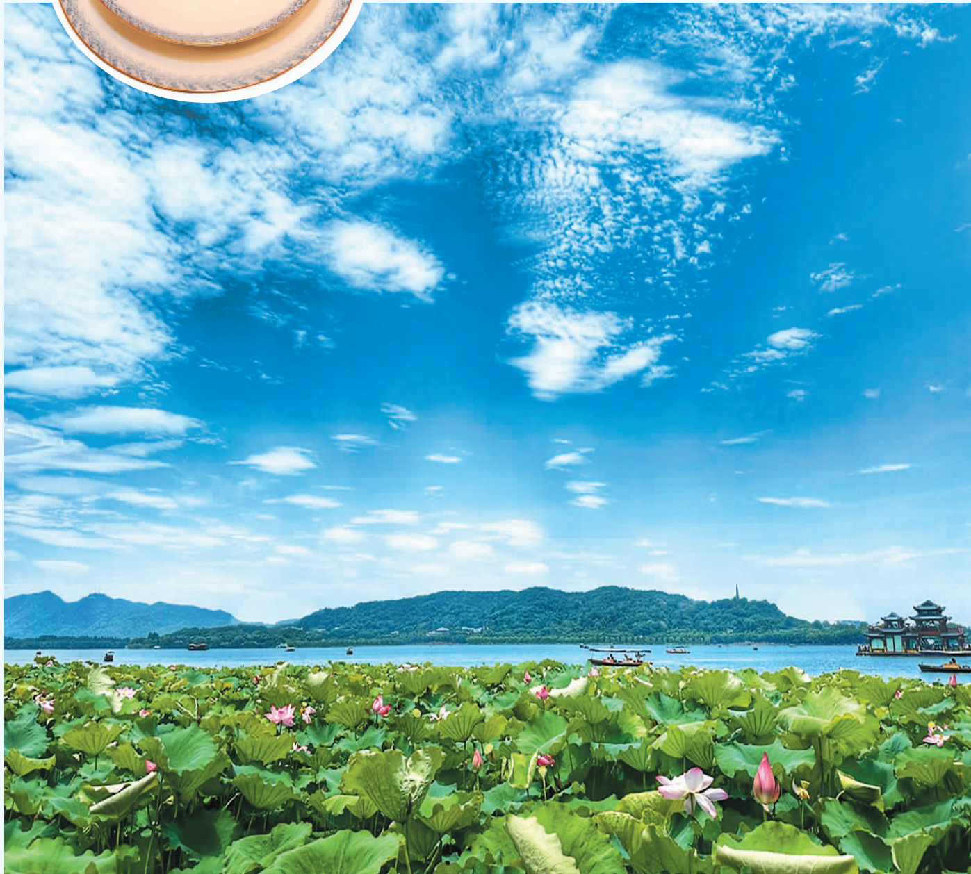
资料图片 吴大庆摄（人民图片）