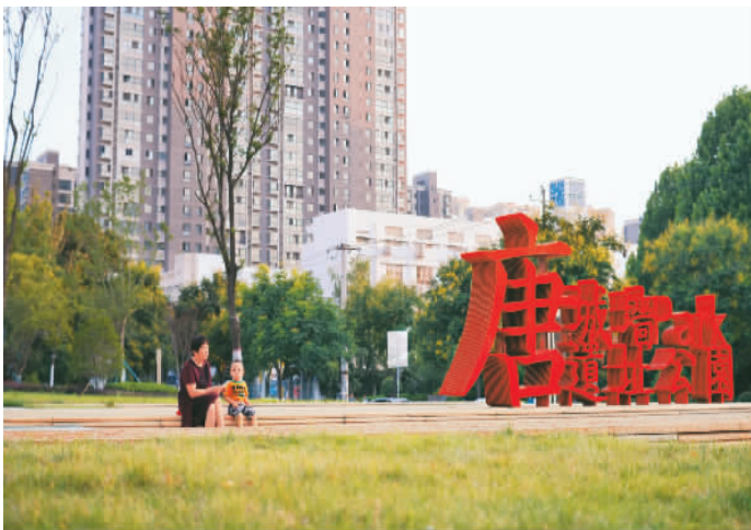
游客在西安市雁塔区唐城墙遗址公园游玩。

此次开放的A段区域为电子正街至电子西街段，总面积4.5万平方米。下一步，将按照公园建设总体规划和考古工作计划，及早启动电子正街到规划路段的公园开放，更好地惠及周边群众。