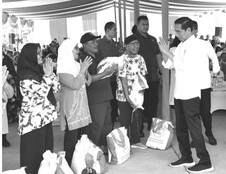
总统视察粮储局仓库大米库存

万亿盾。 在今年9月至11月期间,每户收益家庭连续三个月将得到30公斤大米或每个月得到10公斤大米。 (Sm)