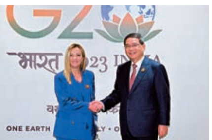
◆9月9日下午，李強在新德里出席二十國集團領導人峰會期間會見梅洛尼。新華社

李強指出，二十國集團成員應當堅守團結合作初心，扛起和平與發展的時代責任。要切實加強宏觀經濟政策協調，為世界經濟增長傳遞信心、提供動力，做推動全球經濟復甦的夥伴；要堅定推進經濟全球化，共同維護全球產業鏈供應鏈穩定暢通，做推動全球開放合作的