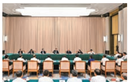
◆9月7日下午，中共中央總書記、國家主席、中央軍委主席習近平在黑龍江省哈爾濱市主持召開新時代推動東北全面振興座談會並發表重要講話。

在維護國家「五大安全」中的重要使命。國家「五大安全」，包含哪些方面？在五年前的瀋陽座談會上，總書記早就言明：東北地區是我國重要的工業和農業基地，維護國家國防安全、糧食安全、生態安全、能源安全、產業安全的戰略地位十分重要，關乎國家發展大局。