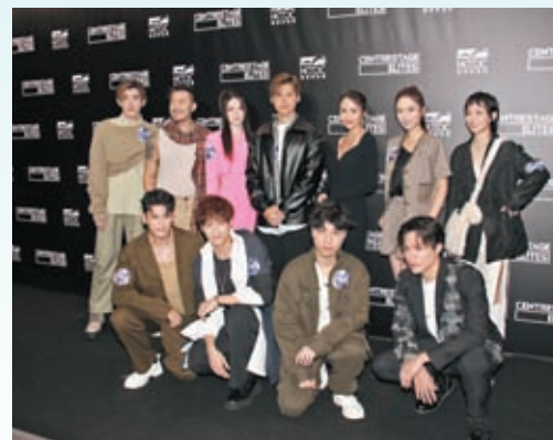
◆眾星型格裝扮到場欣賞時裝展。