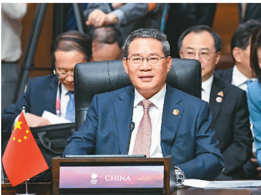
当地时间9月7日上午，国务院总理李强在印度尼西亚雅加达出席第18届东亚峰会。

本报雅加达9月7日电（记者章念生、陈尚文）当地时间9月7日上午，国务院总理李强在印度尼西亚雅加达出席第18届东亚峰会。