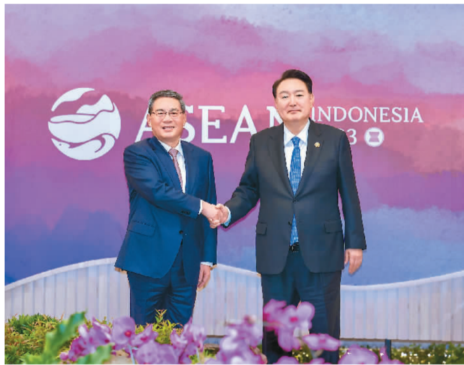
当地时间9月7日下午，国务院总理李强在雅加达出席东亚合作领导人系列会议期间会见韩国总统尹锡悦。

本报雅加达9月7日电（记者陈尚文、张矜若）当地时间9月7日下午，国务院总理李强在雅加达出席东亚合作领导人系列会议期间会见韩国总统尹锡悦。