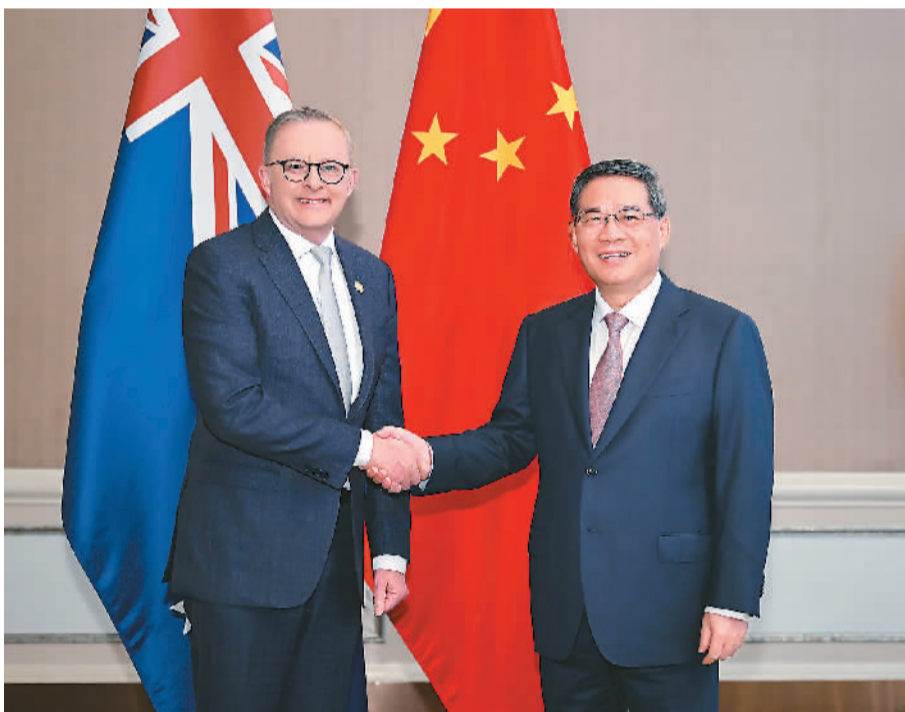
当地时间9月7日上午，国务院总理李强在雅加达出席东亚合作领导人系列会议期间会见澳大利亚总理阿尔巴尼斯。

本报雅加达9月7日电（记者陈尚文、刘慧）当地时间9月7日上午，国务院总理李强在雅加达出席东亚合作领导人系列会议期间会见澳大利亚总理阿尔巴尼斯。