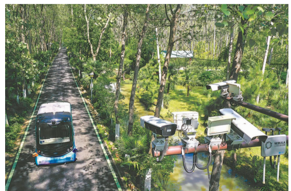
电动无人观光车在合肥滨湖国家森林公园内运送游玩的游客。园区内还投入无人驾驶售卖车、无人驾驶清扫车、无人驾驶安防车,整个园区形成了全方位一体化的智能网联创新应用生态。