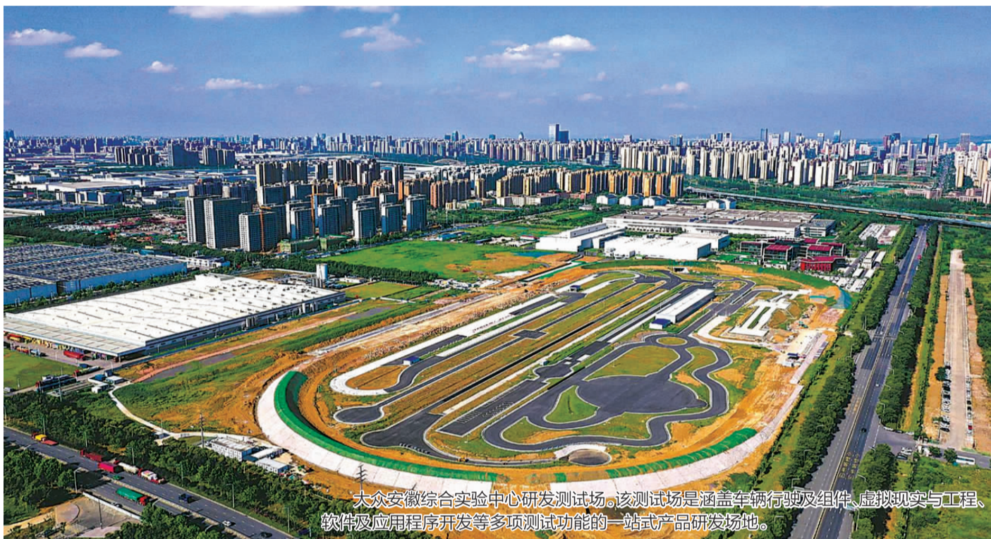
大众安徽综合实验中心研发测试场。该测试场是涵盖车辆行驶及组件、虚拟现实与工程、软件及应用程序开发等多项测试功能的一站式产品研发场地。

蚌埠国显科技有限公司生产车间内,技术人员在对试产中的车载触控显示模组生产线设备进行调试。