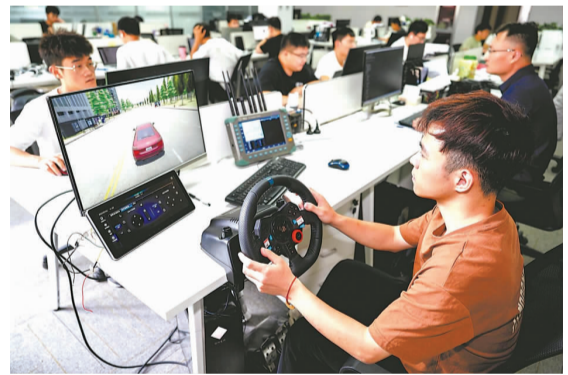
安徽星云互联科技有限公司内,技术人员在对车路协同智能网联系统进行测试。