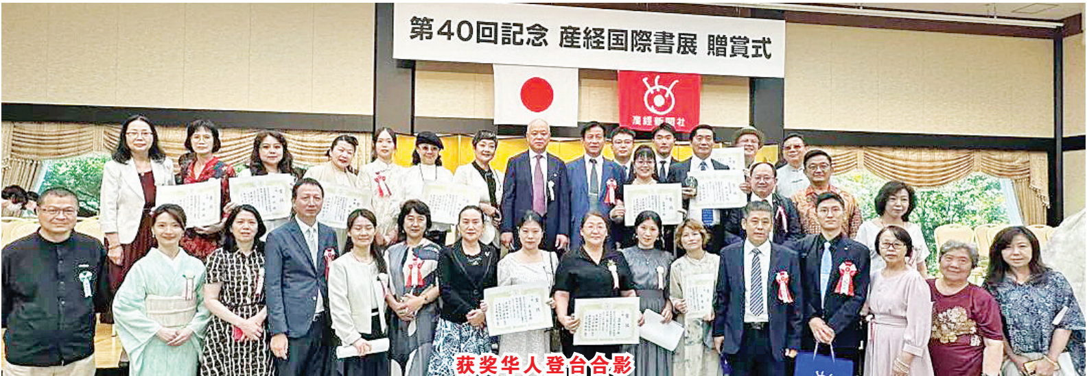
获奖华人登台合影

【本报讯】8月14日，第40届日本“产经国际书展”在上野东京美术馆拉开序幕，为书法爱好者和艺术观众们带来一场视觉与心灵的盛宴。在这个令人心驰神往的季节，无数才华横溢的书法家将齐聚一堂，展示他们的创作力量和艺术魅力。