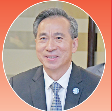
中际贸促会会长任鸿斌

【本报讯】为了加强印中两国之间的贸易关系，中国贸促会会长、中国国际商会会长任鸿斌于2023年9月6日星期三