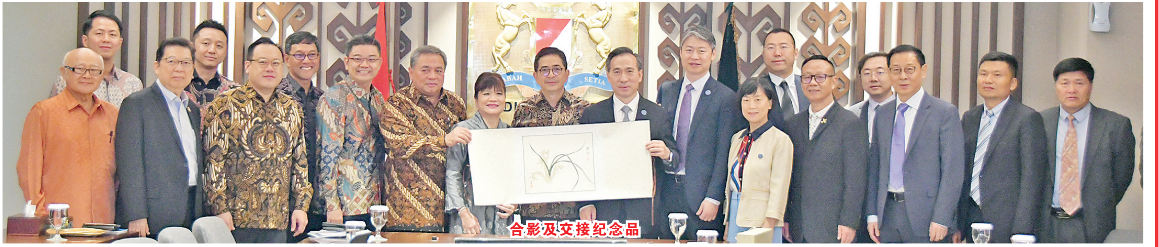
合影及交接纪念品