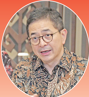
印尼工商会总主席阿尔夏德