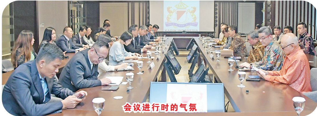
会议进行时的气氛