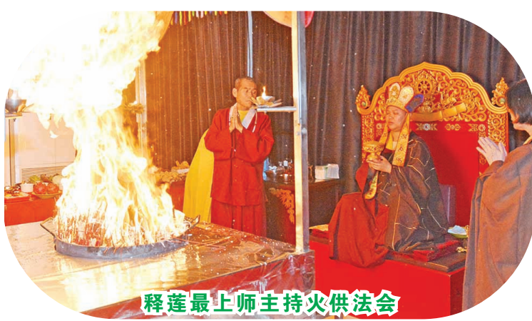
释莲最上师主持火供法会