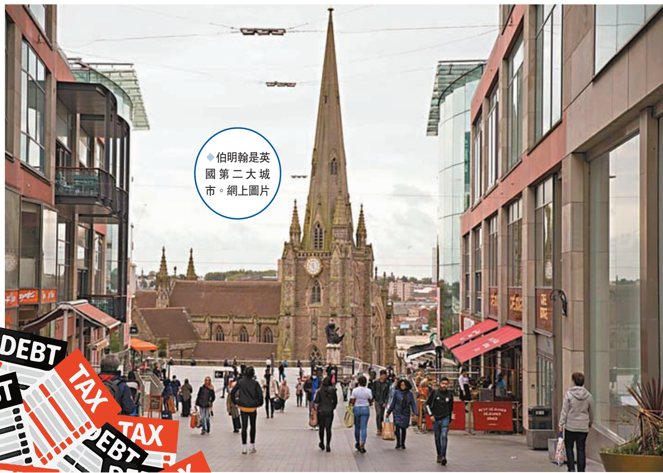
伯明翰是英國第二大城市。

香港文匯報訊 英國第二大城市伯明翰的市政委員會9月5日宣布該市破產，表示預算缺口高達8,740萬英鎊，除保護弱勢群體等法定服務外，伯明翰市將停止所有新的開支。