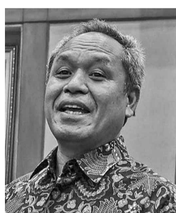
民主党副主席本尼 总统候选人-副总统候选人。(亮剑)