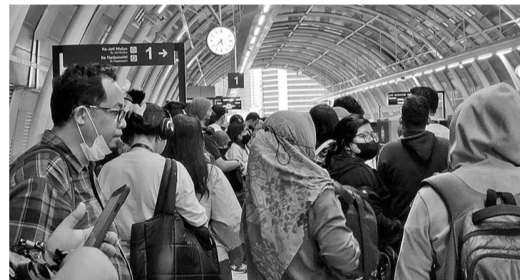
轻轨铁路列车获得上班族热烈欢迎