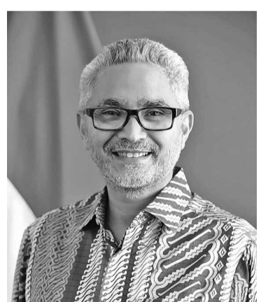
印尼外交部亚太区总署长 阿卜杜勒·卡迪尔

【本报讯】在出席美拉尼西亚国家峰会(MSG)的印度尼西亚代表团据称试图贿赂与恐吓新西兰广播电台(RNZ)媒体记者后，印度尼西亚外交部为此公开发表声明予以否认。