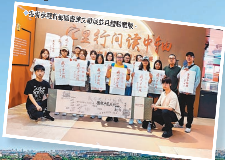
港青參觀首都圖書館文獻展並且體驗雕版。