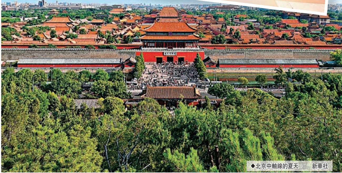
◆北京中軸線的夏天。

◆香港文匯報記者 朱輝 凱雷 實習記者 岑嘉怡 趙一霖 北京報道