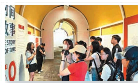
▲港青參觀鐘鼓樓，聽講解員講時間故事及看展覽。