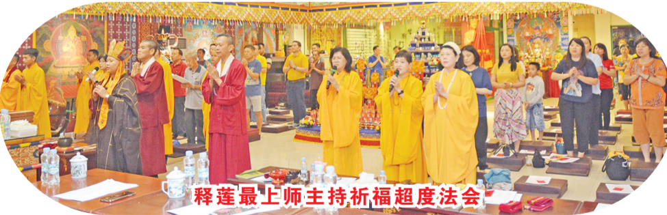
释莲最上师主持祈福超度法会