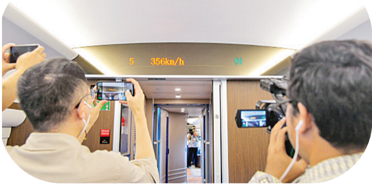
6月22日，在雅万高铁进行联调联试的综合检测列车上，记者们拍摄显示列车时速超过350公里的电子屏。

印尼中国高速铁路有限公司成立于2015年，是由中国企业联合体与印尼企业联合体组建的合资公司，负责雅万高铁项目的建设和运营。