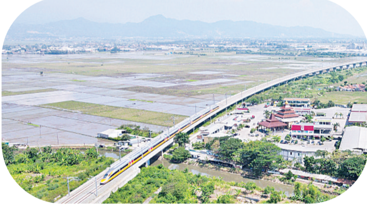
6月22日，在万隆，综合检测列车行驶在雅万高铁上(无人机照片)。