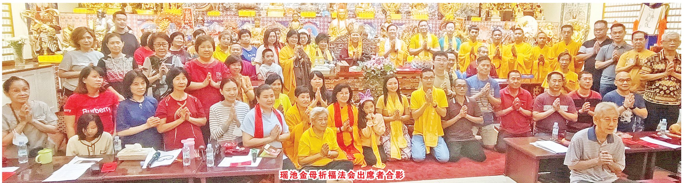
瑶池金母祈福法会出席者合影