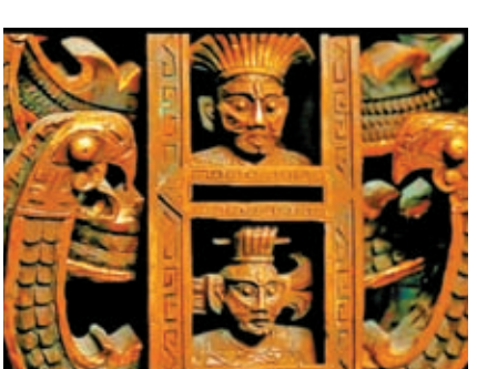
《封神》大殿裏所有細節都是參考了各個博物館不同時期的歷史文物，由數百名藝術家 and 工匠經過數月完成。