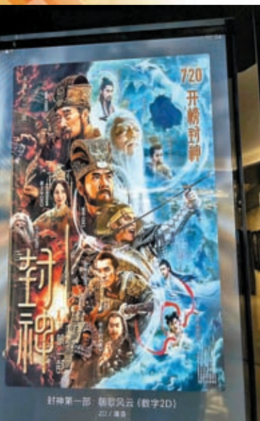
電影《封神》正在內地熱映。

「以前都羨慕紂王，現在羨慕小狐狸。」許多人衝着「小鮮肉」去看《封神》，最後卻被費翔飾演的商紂王迷住。身形高大雄健，神態不怒自威，費翔在拍攝該片時已經59歲，身材管理竟絲毫不輸戲中年輕演員。從為期三個月武術、馬術、擊鼓訓練，到長達一年多時間嚴格控制飲食和健身鍛煉，讓費翔擁有了一副令人信服的武將外形。他的自律贏得了媽媽粉到孩子粉的青睞。媽媽粉們表示，「費叔叔」不光會演戲，還唱跳俱佳、出演音樂劇，聲台形表樣樣拿得出手。在一場場路演中，他的敬業、風度與修養收穫了大批年輕粉絲。大家紛紛表示，看完電影迷上了媽媽追過的偶像。大批網友在費翔的社交賬號下刷屏：「費翔老師是我從小追到老的明星！」「《封神》推動了很多年輕人了解中國傳統文化，謝謝大王！」