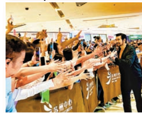
商紂王飾演者費翔贏得眾多粉絲青睞。 網上圖片

李享還提到，作為投資方、製作方，需要有產業融合意識，才能最終促成融合項目的落地。影視主題公園旅遊方面，影視製作是上游源頭。如今不少電影從業人員已開始關注周邊產品等除電影本身以外的項目，這些周邊產品距離電影這個「圓心」很近，涉及的多為短期回報。而影視主題公園是長線投資，涉及如何增強產業融合意識和投資理念，是一個較為宏大的問題。未來，需要更多的電影投資人、製作方，關注長線投資，從大周邊、大衍生產業的角度去考慮未來電影衍生的可能性，以延展其產業鏈。在這個過程中，也需要一些有計劃發展影視主題公園的地方政府的積極推動，搭建平台推薦自己，以促進影視主題公園落地，走出中國傳統文化影視主題公園的發展路徑。