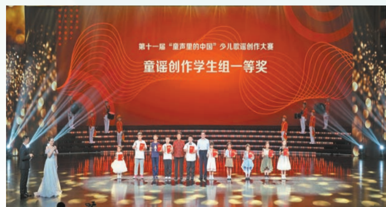
童謠創作學生組一等獎獲頒證書、獎盃。

活動期間，主辦方還組織了「童聲裏的中國」品牌發展研討會。南通市委常委、通州區委書記張建華表示，通州正進一步將「童聲裏的中國」少兒藝術研創活動基地打造成傳播中華文化、弘揚社會主義核心價值觀、助