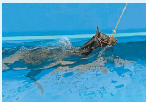
賽馬在從化馬場游泳。