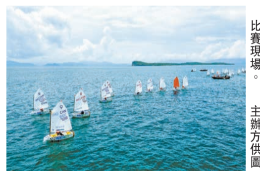
比賽現場。

【香港商報訊】記者羅國維 通訊員南宣報導：2023「大鵬灣盃」深港澳帆船賽近日在深圳大鵬新區南澳月灣灣開帷，來自深圳、香港、澳門的60名青少年賽手參賽。