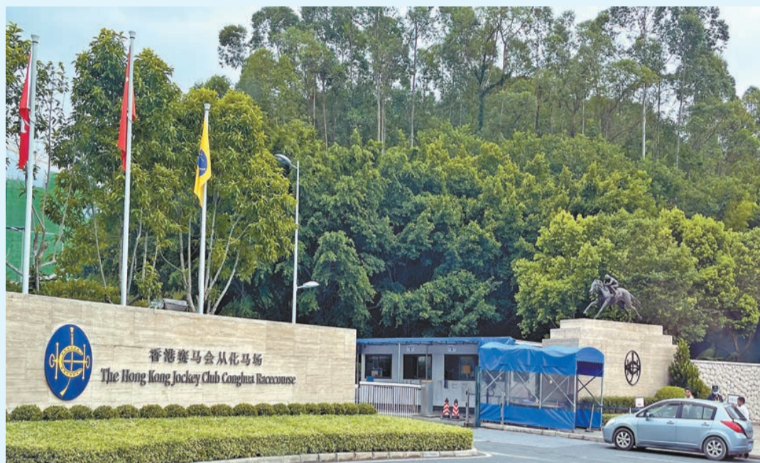
香港賽馬會從化馬場。