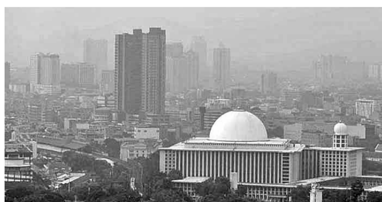
空气污染是我国第五大死亡风险因素。

部。几乎在严重污染的所有国家的颗粒物都是PM2.5。”在这次机会中，古纳迪也承认，迄今为止，我国仍未达到世卫组织新规定PM2.5的安全标准。目前我国引用的仍是世卫组织的旧规定，即平均24小时内每立方米55微克，平均每年每立方米15微克。他说：“这是卫生部及环保部引用的规定标准。然而今年世卫组织发布新规定，PM2.5 极度危害人体健康。”