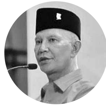
印尼斗争民主党中央理事会主席沙益德

【本报讯】印尼斗争民主党中央理事会主席沙益德·阿卜杜拉 (Said Abdullah) 表示，印尼斗争民主党已经习惯了被各政党围攻，因此并不担心对方的阵营越来越强大。印尼斗争民主党经历过作为一个受过教育，以及习惯性地