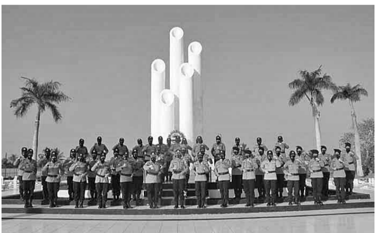
9月1日是女警队成立纪念日

根据罗盘报社于1966年7月29日的报道，将女警小组升级为女警队的建议势在必行，此外也希望女性警员能像男性警员一样，作为执法人员维护社会安全。事后国家警察总部就将女警小组