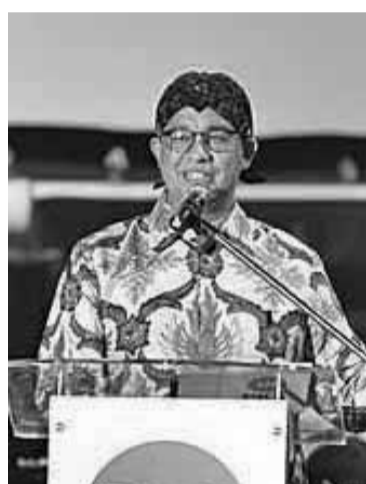
公福党仍支持阿尼斯参选