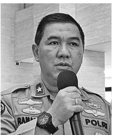
国家警察公关局公共信息处主任拉马丹

【本报讯】反贩卖人口犯罪 (TPPO) 特遣队宣称，2023年6月5日至8月27日期间，该单位共收到794份报告。这些报告不仅由中央级别的TPPO特遣队接收，还包括地方级别。在这些报告中，有962名嫌疑人被拘留。国家警察公关局公共信息处主任拉马丹 (Ahmad Ramadhan) 准将日前在雅加达的国家警察总部表示：“在这期间，TPPO 逮捕了