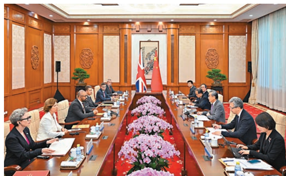
◆ 8月30日，中共中央政治局委員、外交部長王毅在北京同英國外交發展大臣克萊弗利舉行會談。