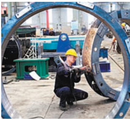
◆山西太原華冶公司工人生產作業，趕製出口訂單。

仲量聯行大中華區首席經濟學家兼研究部總監龐溟表示，基本面復常和政策面加力正逐步抵消擾動中國經濟復甦的短期因素，8月份PMI數據好於預期有望給市場帶來較積極的信息和反應。但數據也顯示出需求不足仍存，服務消費能否持續穩定擴張將繼續引起關注。