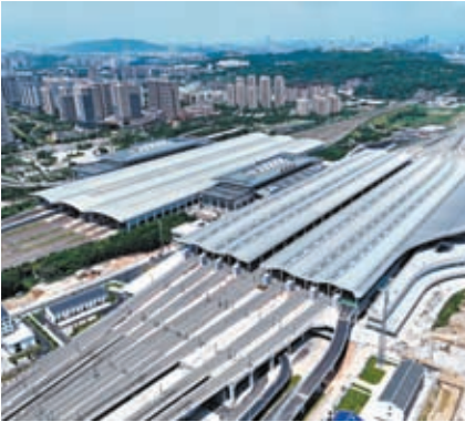
◆新建成的福廈高鐵路福州南站站房（8月29日攝，無人機照片）。

作為中國智能鐵路最新科技成果的集成化應用，福廈高鐵路將開行復興號智能動車組。中鐵