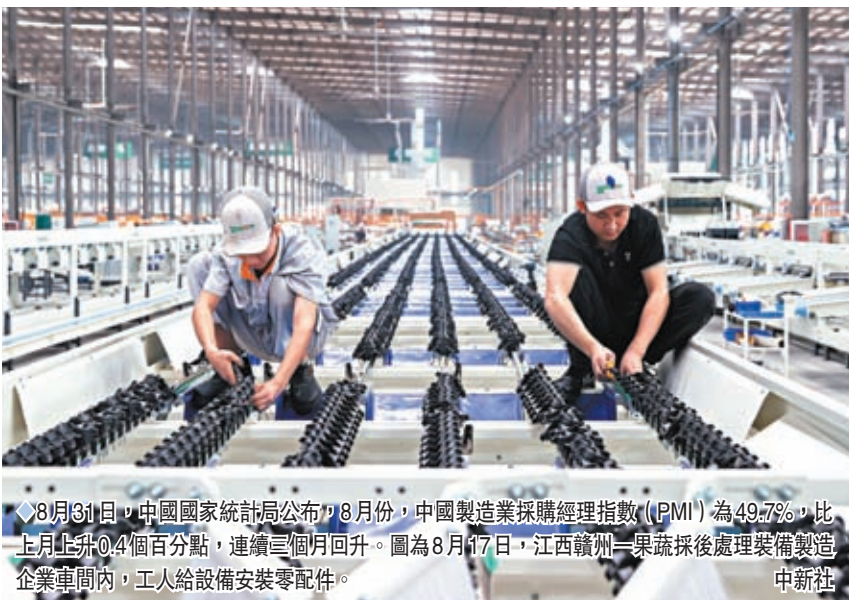
◆8月31日，中國國家統計局公布，8月份，中國製造業採購經理指數（PMI）為49.7%，比上月上升0.4個百分點，連續三個月回升。圖為8月17日，江西贛州一果疏採後處理裝備製造企業車間內，工人給設備安裝零配件。