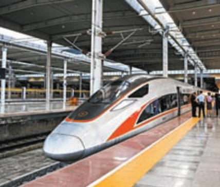
◆8月31日的貴南高鐵路開通運營的首趟由南寧東開往貴陽北的G4308次列車。

貴南高鐵路線的貫通讓廣西在邁入「時速350公里時代」的同時，實現了「市市通高鐵路」。貴南高鐵路通過貴陽鐵路樞紐與滬昆高鐵路、成貴高鐵路、渝貴高鐵路、貴廣高鐵路等線路連接，通過南寧鐵路樞紐與南廣高鐵路，南寧至北海、防城港、崇左等北部灣地區群間的城際鐵路相連，構成西南至華南沿海一帶地區的高速鐵路大通道。它的開通運營，將進一步便利沿線各族民眾出行，助力旅遊等產業發展，對支持民族地區加快發展、促進高水平對外開放，具有重要意義。