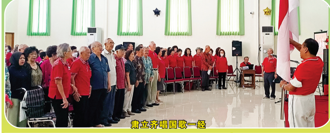
肃立齐唱国歌一经