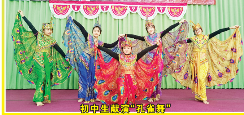
初中生献演“孔雀舞”