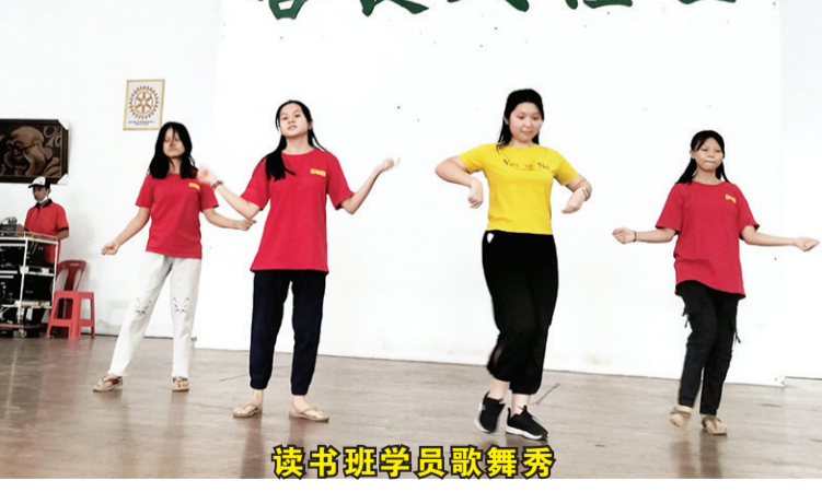
读书班学员歌舞秀