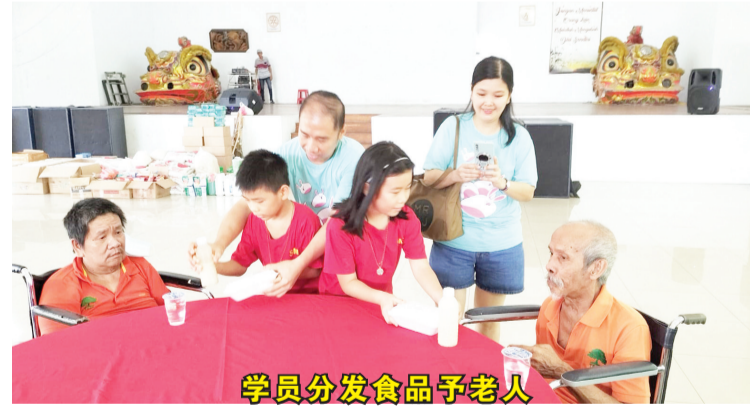
学员分发食品予老人