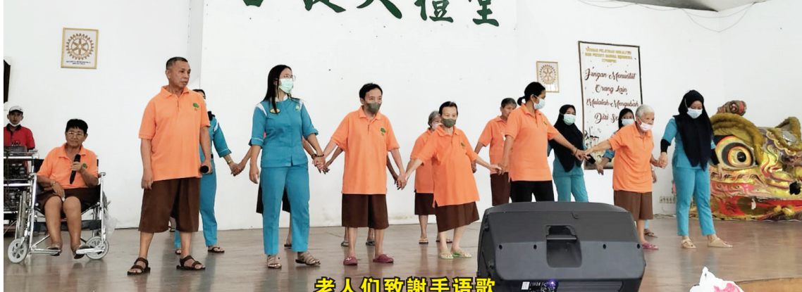
老人们致謝手语歌