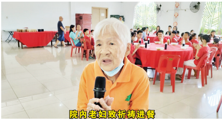
院内老妇致祈祷进餐