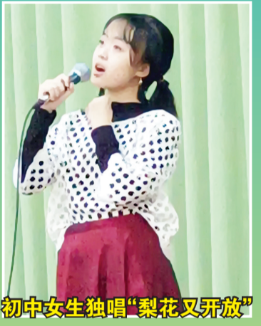
初中女生独唱“梨花又开放”