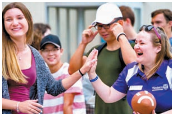
◆加拿大西安大略大學規定迎新周學生領袖參加培訓。