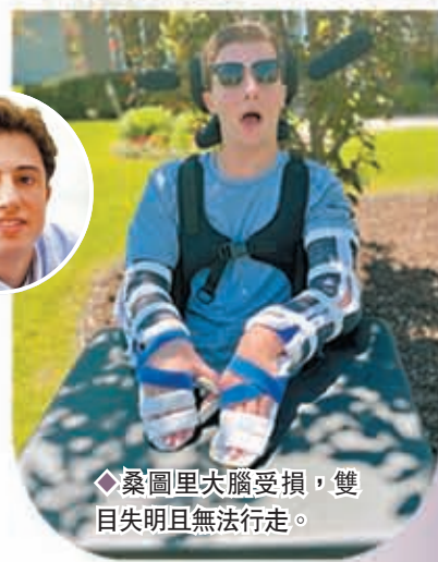
◆桑圖里失腦受損，雙 目失明且無法行走。