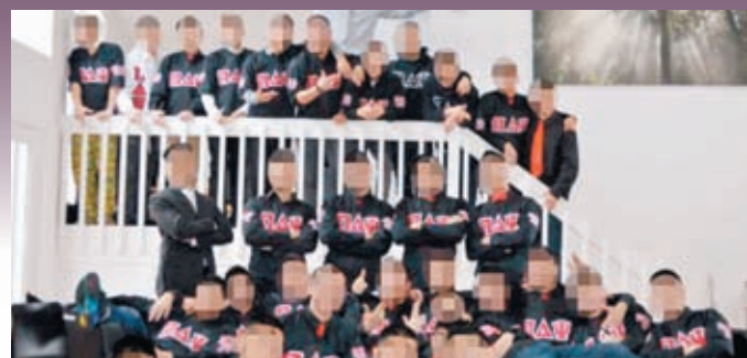
◆派—德爾 塔—普賽兄弟 會成員合照。

香港文匯報訊 在過去20至30年間，因受到美國白人校園兄弟會排斥，亞裔在美國廣泛建立屬於自己的兄弟會。然而近年隨着數量增加，成員被欺凌致死事件時有發生，引發美國社會關注，甚至曾有亞裔兄弟會被警方誤認為是亞洲黑幫。