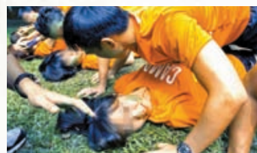
▲▼新加坡國立大學新生作出一些猥褻動作及模仿性愛姿勢。

新加坡南洋理工大學在2019年迎新活動上，一群男女學生在叫喊口號時，不斷重複意指男性性器官的字眼，並作出一些猥褻動作。校方批評相關行為違背了大學迎新活動所強調的安全、尊重和包容價值觀，已着手調查。