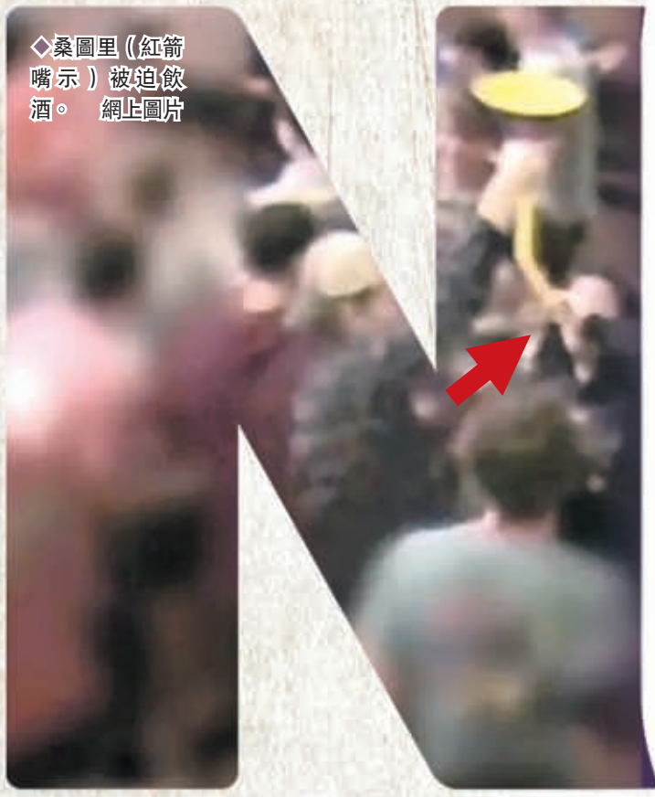
◆桑圖里(紅箭 嘴)被迫飲 酒。