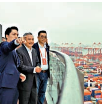
台北市市長蔣萬安一行29日參觀上海洋山深水港。

蔣萬安此次訪問上海的其中一個重要行程是體驗上海夜間經濟。他於29日晚間到訪上海城隍廟口夜市小吃街，還走進遊客到訪上海必打卡景點之一的「豫園商城」。 上海素有「不夜城」之稱，2022年上海夜間消費總規模為4,918億元人民幣，夜間經濟綜合指數排名大陸第一。