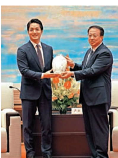
29日在會面中，上海市市長龔正向台北市市長蔣萬安贈送瓷器「玉蘭花開」。 香港文匯報記者張帆攝

能的事」。台北也經歷過垃圾掩埋的歷史，但是用垃圾分類，減少垃圾量，也減輕了後續處理的環保議題。身為致力解決問題的市長，這是他很有感觸的第一印象。「我們要永續經營一座城市。」 龔正贈送蔣萬安瓷器「玉蘭花開」，底影設計以簡約線條勾勒出上海浦江兩岸的建築群和上海市花白玉蘭，給人以和諧溫馨的美感。浦江兩岸建築群是上海百年歷史的見證，象徵歷史和現代的融合。朵朵向上的白玉蘭，代表上海人民熱情歡迎台北來的各位貴賓，象徵兩市人民之間的真情誼。作品寓意兩市人民合作共贏，共同追求未來美好生活。 蔣萬安則回贈「春池玻璃一靚瓶」。這是以TFT回收玻璃原料手工精製而成。透過國寶級工藝師傅的巧手，對原本廢棄的玻璃，重新賦予非凡的藝術價值。精緻優雅的「靚瓶」兼具藝術與環保層面，呼應本屆論壇主題「新趨勢新發展」，展現出永續共融的無限可能。