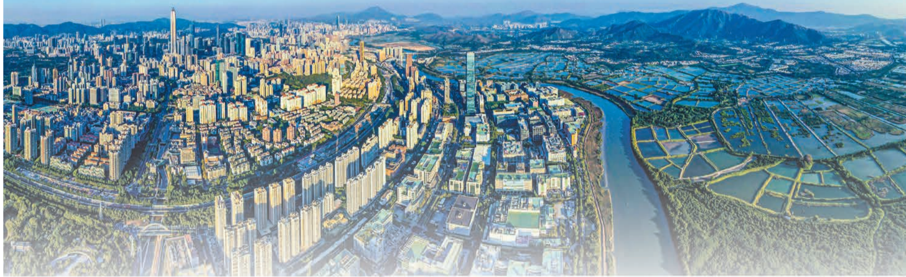
河套深港科技創新合作區俯瞰。

【香港商報訊】據新華社報道，國務院日前印發《河套深港科技創新合作區深圳園區發展規劃》（以下簡稱「規劃」），要求以習近平新時代中國特色社會主義思想為指導，高質量、高標準、高水平推進河套深港科技創新合作區深圳園區建設，積極主動與香港園區協同發展、優勢互補，打造粵港澳大灣區國際科技創新中心重要極點，努力成為粵港澳大灣區高質量發展的重要引擎。（尚有相關報道刊A12版）