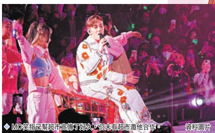
MC笑指已幫超市宣傳了好久，仍未有超市邀他合作。資料圖片