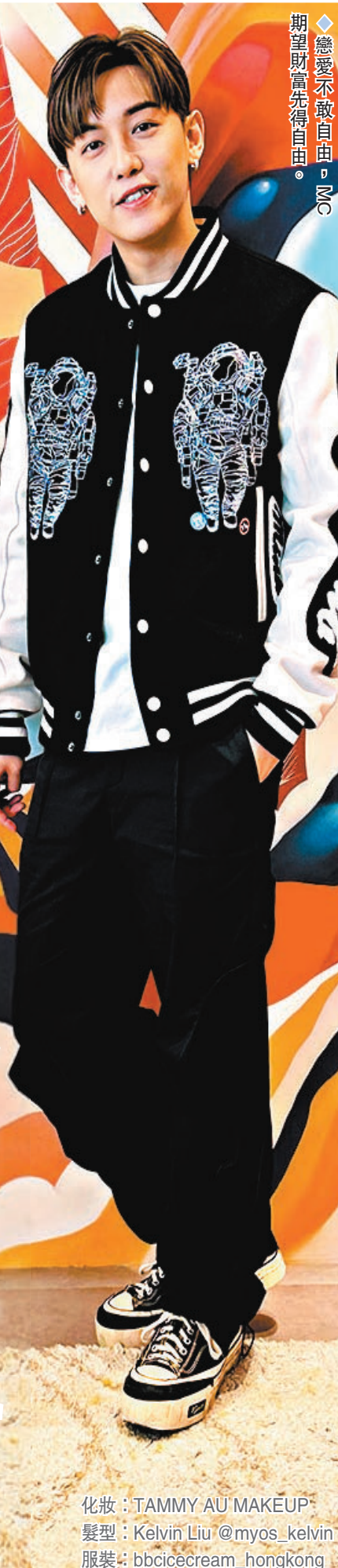
化妝：TAMMY AU MAKEUP 髮型：Kelvin Liu @myos_kelvin 服裝：bbcccream_hongkong