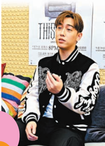
MC指今次首個海外個唱會注入澳門元素。