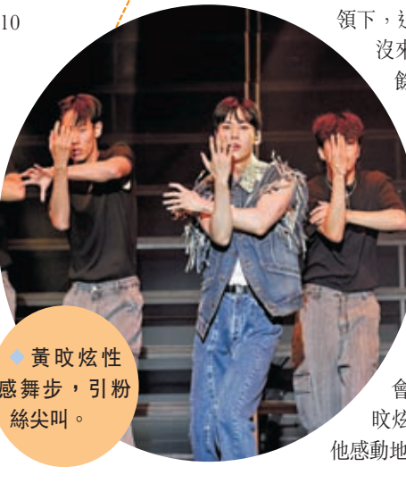
黃旼炫性感舞步，引粉絲尖叫。

緊接而來，黃旼炫送上慢歌《Honest》，以及由他負責作詞的《Earphone》。而黃旼炫在聊天環節，除準備了已放置好他的周邊的環保袋作為小禮物送給粉絲，更透露特別為港漫地區的觀眾，苦練了中文歌曲，並演唱電視劇《想見你》片尾曲《想見你想見你想見你》，在全場Hwangdo的手燈襯托下，構成一幅浪漫畫面。來到演唱會的末段，黃旼炫除準備了新歌《Crossword》外，還預備了全場大合照環節，而粉絲們也為黃旼炫送上特備的應援。除全場一同舉起「Hwangdo將軍和Hwangdo，在不會完結的快樂中牽着手一起生活下去！」的韓文手幅，也播放了黃旼炫出道至今，擔任solo歌手及演員每個重要時刻的雜誌片段，讓他感動地表示會用更好的表演回報粉絲。