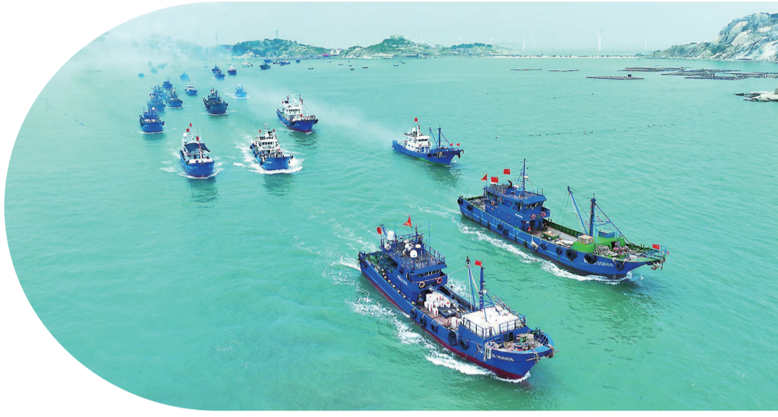
8月16日，福建省首屆開海文化季（莆田分會場）活動在南日鎮浮葉一級漁港舉行。圖為漁港碼頭排列整齊的漁船，鳴笛列隊出海，場面壯觀。

（莆田網訊）8月16日上午，由省文化和旅游廳、省海洋與漁業局、莆田市人民政府主辦的“福見揚帆 漁海同樂”福建省首屆開海文化季（莆田分會場）暨2023年秀嶼·南日島漁業態推介會在南日鎮浮葉一級漁港舉行。