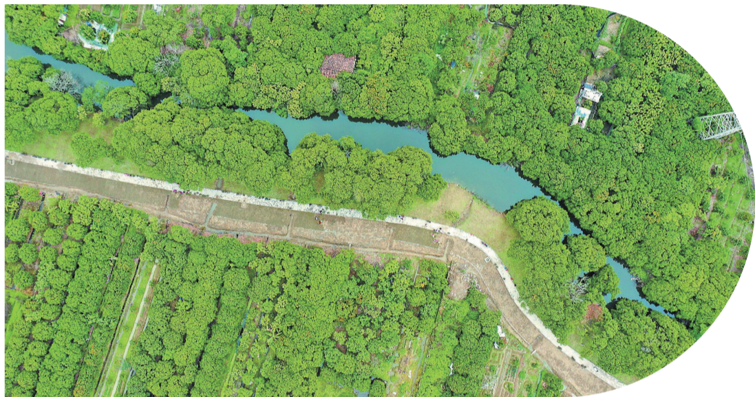
我市堅持生態優先、綠色低碳、人水和諧，打造山水詩畫生態韻城。圖為市區延壽西溪下游，一條新修建的綠道沿溪岸向前蔓延，成為市民休閒健身新去處。

在保護綠色生態上下功夫，建設“生態好”先行市；在發展綠色產業上下功夫，建設“產業優”先行市；在建設綠色城鄉上下功夫，建設“城鄉美”先行市；在增進綠色福祉上下功夫，建設“百姓富”先行市