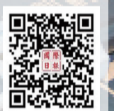
掃一掃，更多精彩新聞與您分享

新華社北京8月27日電——美國警方26日通報，佛羅里達州北部杰克遜維爾市一名白人男子當天在一家商店開槍打死3名黑人，隨後開槍自盡。