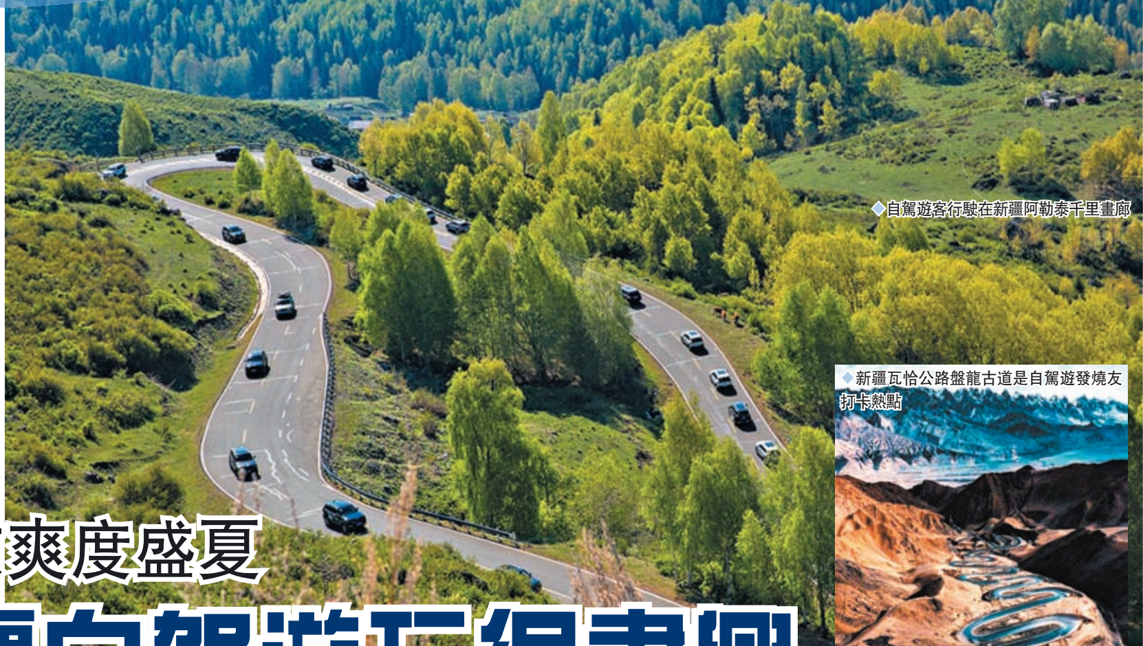
◆自駕遊客行駛在新疆阿勒泰千里畫廊