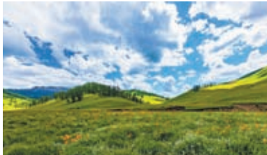
◆新疆阿勒泰千里畫廊東環線風光。