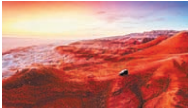
◆自駕遊客行駛在古爾班通古特沙漠吉拉大峽谷。