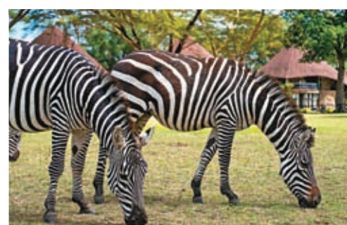
◆奈瓦沙湖沿岸的斑馬。

位於非洲東部的肯尼亞，東非大裂谷縱貫南北，赤道橫貫其中。沿海為平原地帶，其餘大部分為平均海拔1,500米的高原，氣候溫和適宜。肯尼亞旅遊資源豐富，是全球最佳野生動物觀賞地之一，其境內的馬賽馬拉國家保護區、安博塞利國家公園聞名世界，吸引世界各地旅遊愛好者前往。