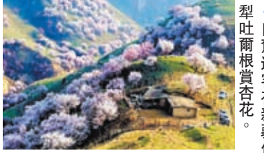
◆自駕遊客在新疆伊犁吐爾根賞杏花。