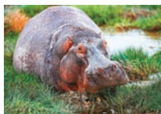
◆安博塞利國家公園的河馬。