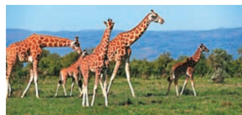
◆納庫魯湖國家公園的長頸鹿。