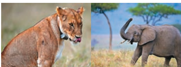
◆馬賽馬拉國家保護區的獅子及大象。