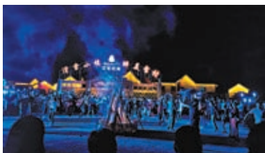
◆新疆可可托海滑雪小鎮裏的篝火晚會。