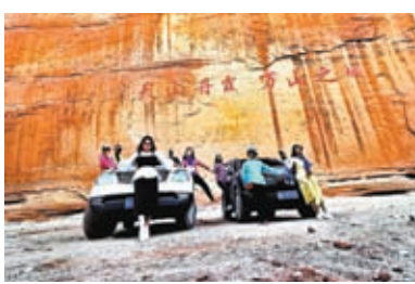
◆自駕遊客在天山丹霞留影。

以烏爾禾國際房車露營公園和獨庫公路國際自駕車營地為代表的「歇腳地」，也從最初簡潔實用的「住宿+燒烤」模式，發展到如今不斷升級引進新業態、做「加法」，持續開展音樂節、篝火晚會、平衡車大賽、航模表演、親子定向賽、火花音樂晚會等豐富多彩、更具文化內涵、親子互動的體驗項目，持續不斷帶來流量，讓「網紅」變「長紅」。