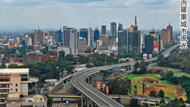
◆肯尼亞內羅畢城市風光