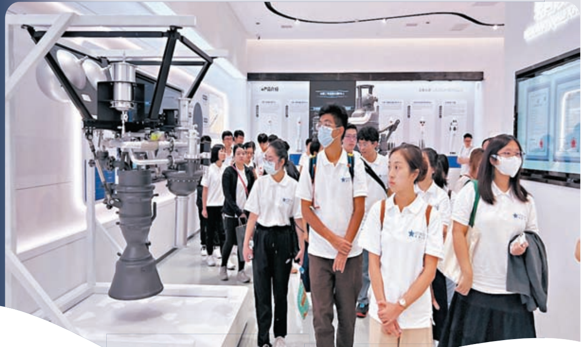
◆港青參觀中科宇航展廳。