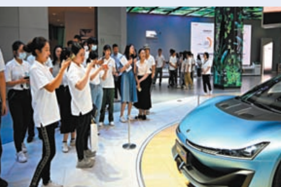
◆港青在廣汽科技館看概念車型。

另一位學員李子揚提到，館內展示的超倍速電池技術，只需充電5分鐘就可為汽車續航200公里，「其實真的很誇張，尤其現在任何事情都講效率，日後也許到車站上個廁所，之後就可以繼續上車滿電前行。」