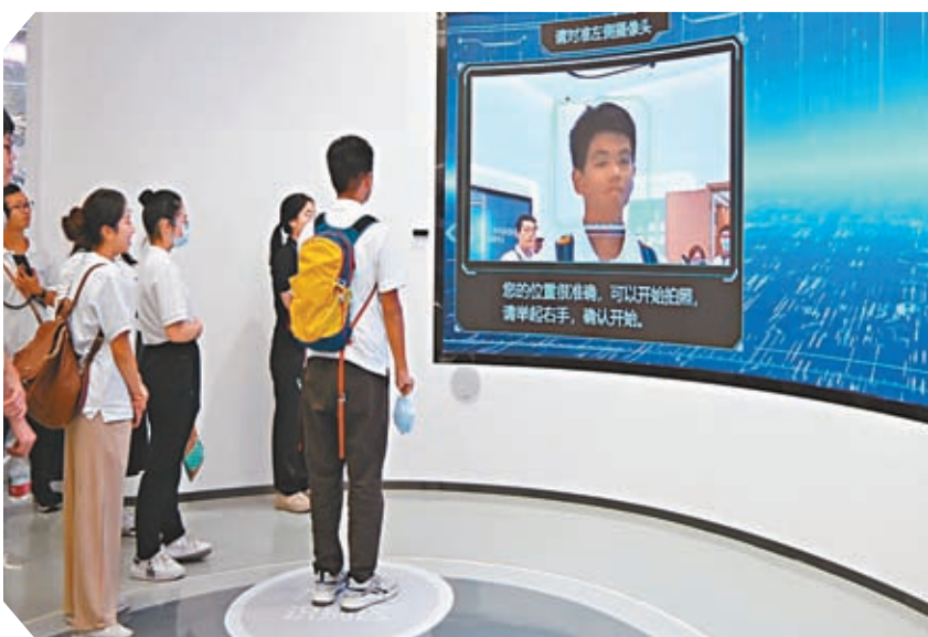
港青在中科宇航體驗互動項目。