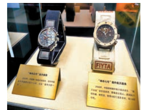
◆飛亞達「航天」手錶。

交流團又訪問了依託中國科學院深圳先進技術研究院腦認知與腦疾病研究所建設的光明腦科學技術產業創新中心。該中心以「需求方出題，科技界答題」為出發點，圍繞腦科學與類腦智能領域產業轉化的關鍵痛點，建設腦科學產業共性技術服務平台，立足大灣區並輻射全國，打造「沿途下蛋+聚集效應」的產業發展生態。