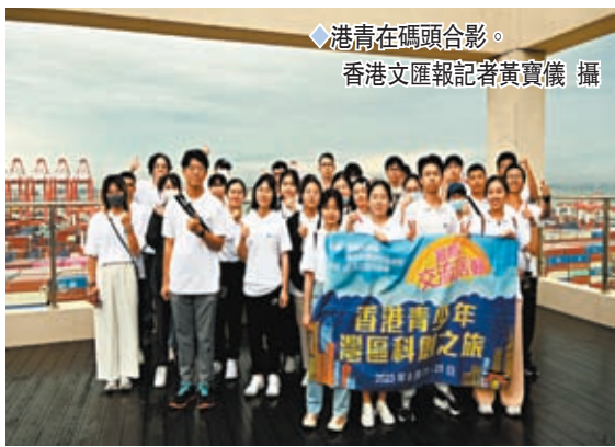
◆港青在碼頭合影。

規模、建設時間，甚至是招聘員工的學歷門檻等都一一探問。當得知該碼頭投資高達70億元人民幣，僅花了五六年時間就有今天的規模，令他和其他港生們都感到不可思議，「漲見識了！」