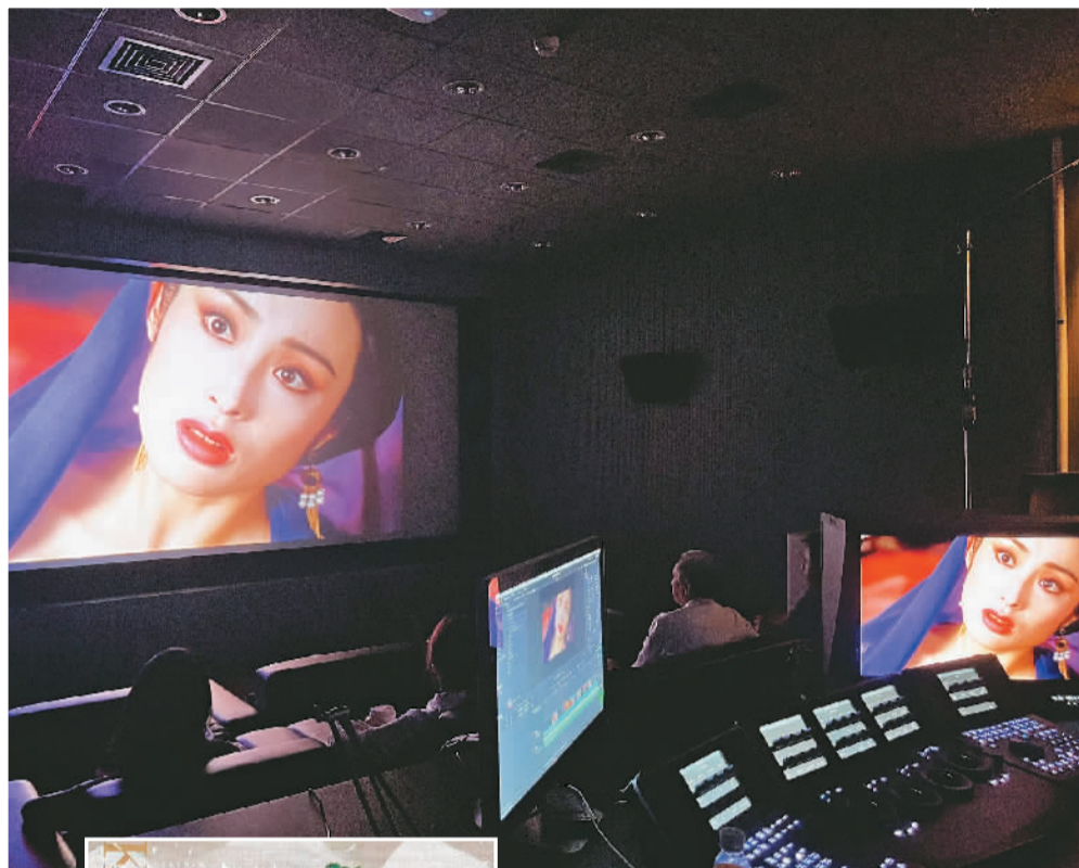
▲导演陈嘉上(右二)参与经典香港电影修复工作。 ▲“经典香港电影修复计划”部分电影海报。

今年5月25日，由爱奇艺和厦门大学电影修复联合实验室共同完成的4k修复版《香魂女》在匈牙利国家电影院放映，数百名观众观看并在映后与导演谢飞交流。《香魂女》于1993年公映，讲述了两代中国农村女性的故事，曾获德国柏林国际电影节金熊奖。爱奇艺有关负责人表示，从2019年起，爱奇艺和新派系文化传媒共同发起“全球经典拷贝修复计划”，对中国经典老电影拷贝进行抢救和修复，修复版《护士日记》曾入围2019年第72届法国戛纳国际电影节“戛纳经典”单元。同年，爱奇艺还推出“经典电视剧数字化修复工程”，对《神探狄仁杰》《激情燃烧的岁月》等经典国产电视剧进行修复。