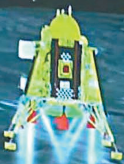
◆印度民眾慶祝「月船3號」成功登陸月球南極。

香港文匯報訊 印度月球登陸器「月船3號」(Chandrayaan-3)23日成功在月球南極著陸，令印度成為繼蘇聯、美國和中國後，全球第4個在月球表面實現著陸的國家，也是首個成功讓登陸器著陸月球南極的國家。印度太空研究組織(ISRO)全程直播「月船3號」著陸過程，總理莫迪也全程觀看直播，並祝賀任務取得重大成功。印度希望今次探月任務能收集更多月球南極附近數據及影像，為月球探索邁出進一步。