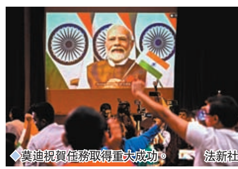
◆莫迪視任務取得重大成功。

火星。歐洲太空探索諮詢公司SpaceTec常務董事菲洛蒂科表示，「印度將太空視為戰略資產，目標是成為該領域主要參與者之一。」