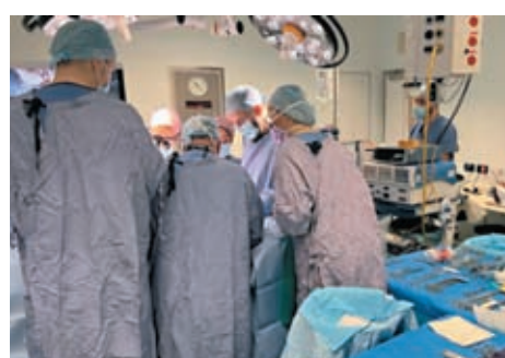
◆醫護人員用接近20小時完成移植，形容手術非常成功。

雖然子宮移植有長期健康風險，接受移植者在懷孕兩次後就要移除子宮，但負責今次手術的醫生形容這是不育治療的新篇章，並為醫護團隊的合作感到自豪。團隊計劃在秋天進行英國第二宗子宮移植手術，目標是以後每年進行最多30宗同類手術。