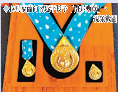
◆拉馬福薩向習近平授予「南非勳章」。

◆特稿 當地時間8月22日上午，正在南非進行國事訪問的中國國家主席習近平在比勒陀利亞總統府同南非總統拉馬福薩會談。會談後，拉馬福薩向習近平授予「南非勳章」，這是南非授予重要友好國家元首的最高級勳章和最高榮譽。