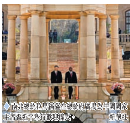
◆南非總統拉馬福薩在總統府廣場為中國國家主席習近平舉行歡迎儀式。

兩國元首就新時代中南關係發展以及共同關心的國際和地區問題深入交換意見，達成重要共識，一致同意，攜手推動中南全面戰略夥伴關係不斷邁上新台階，攜手構建高水平中南命運共同體。