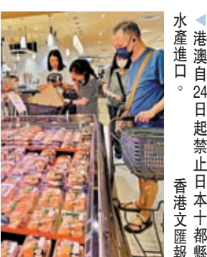
▲港澳自24日起禁止日本十都縣水產進口。香港文匯報

香港文匯報訊（記者湯嘉平報道）日本最快24日起排放核污水落海，污水流向如何？禍延範圍有多廣？何時會漂到中國？根據清華大學的建模結果（左圖），福島核污水將在240天後（即明年4月底）到達中國東南沿海；到2026年12月將蔓延至整個中國東部沿海海域；十年內擴至太平洋對岸。