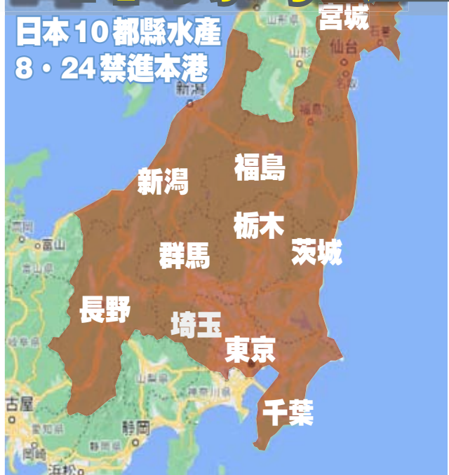
日本10都縣水產 8·24禁進本港

【香港商報訊】記者林駿強報道：日本政府決定於24日起排放福島核污水，全球爭議甚巨。行政長官李家超昨日表示，強烈反對日本福島核廢水排放計劃，又說香港食物安全和公眾健康是特區政府的首要考慮，已即時指示環境及生態局及相關部門立即啟動進口管制措施，保障香港的食物安全和市民的健康。環境及生態局局長謝展寰昨日會見傳媒時表示，明日起來自東京、福島、千葉、栃木、茨城、群馬、宮城、新潟、長野、埼玉這10個都縣的水產品將禁止入口，當局亦會每個工作天公布輻射監測數字。政府跨部門工作小組會在今日舉行記者會交代細節。