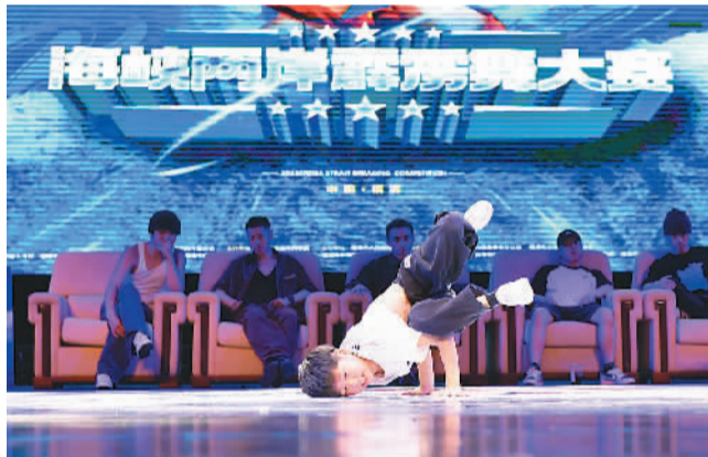
图为在福建福州举办的海峡青年节霹雳舞大赛中，小舞者展示舞蹈动作。

共青团中央书记处常务书记、全国青联副主席徐晓表示，海峡青年节要增强青春温度，让两岸青年当主角，更多引入青年人喜闻乐见的快闪、街舞、直播、电竞等时尚元素，用人工智能、虚拟现实等数字技术为交流赋能。“要让活动既有意义又充满趣味，不断增强对两岸青年的吸引力和凝聚力。”他说。