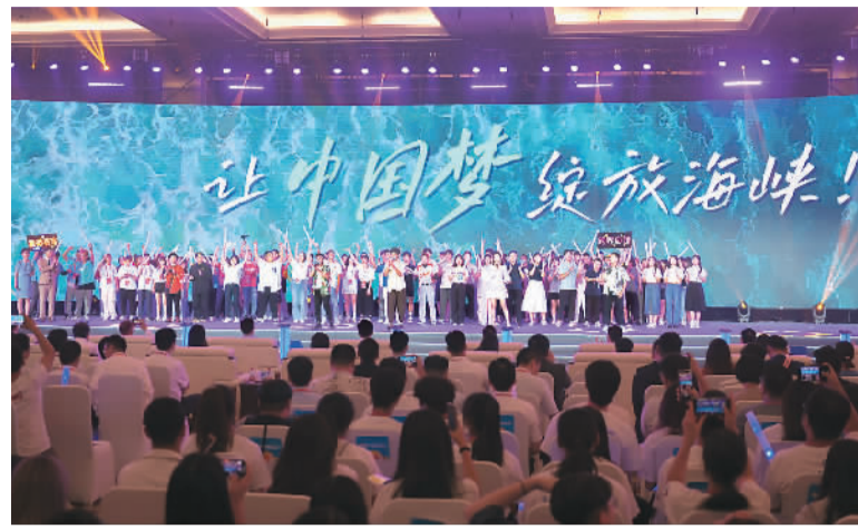
图为两岸青年合唱海峡青年节峰会主题曲《青春海峡》。

“虽然大家来自两岸不同地方，但因为生活在同一个时代，学习着相同的知识，所以我们有