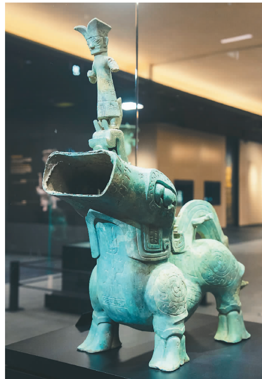
▲三星堆八号坑出土的青铜神尊。

2019年以来，三星堆遗址新发现三号至八号祭祀坑。这6个坑的考古发掘采用多学科融合、多团队合作的方式，搭建恒温恒湿的考古工作舱，综合运用多种高科技设备，并在考古现场设立应急保护实验室，将文物保护贯穿整个发掘过程。据介绍，目前除五号坑外已全部清理完毕，出土象牙、青铜器、金器、玉器文物1.7万余件。