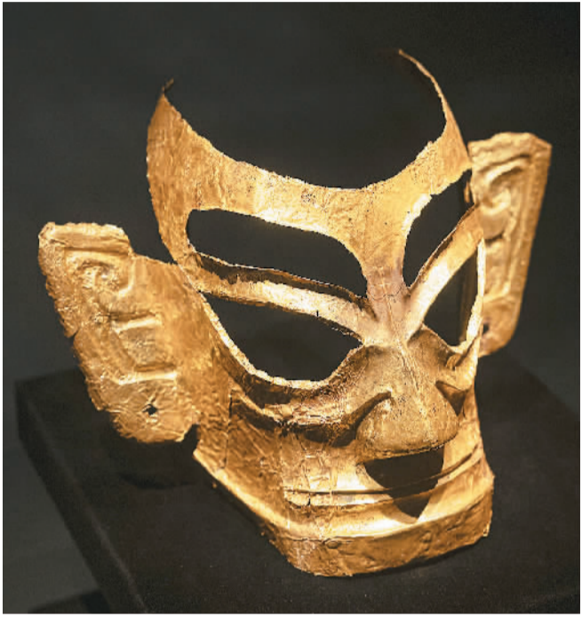
▲三星堆八号坑出土的金面罩。