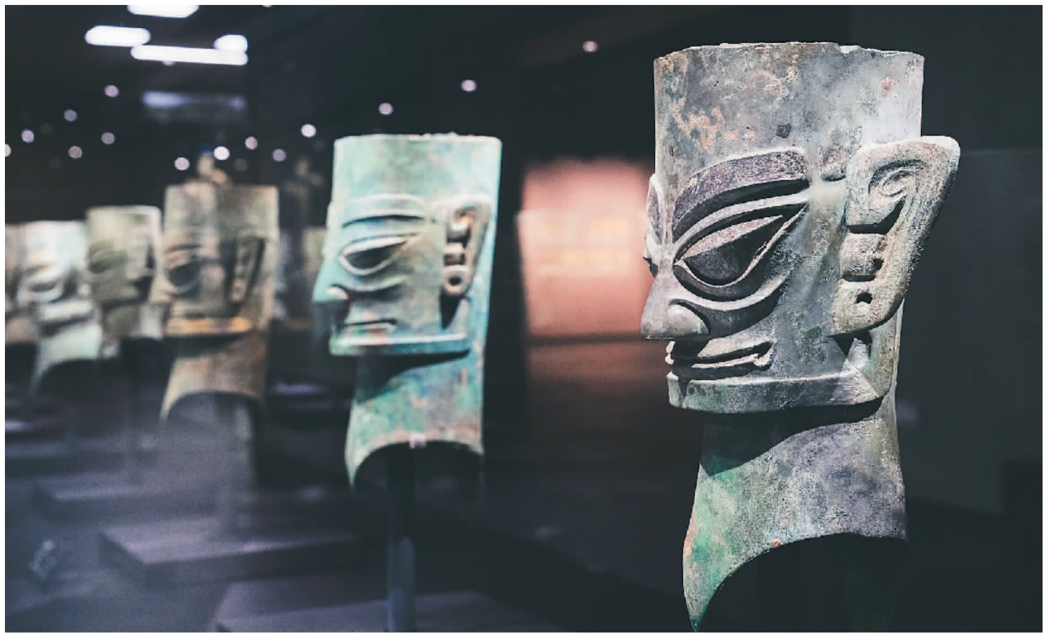
▲三星堆博物馆新馆“巍然王都”展区陈列的青铜人头像。