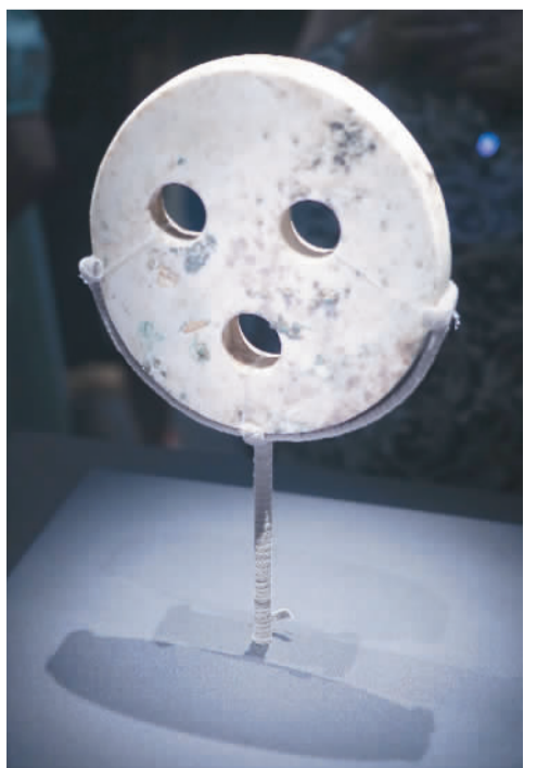
▲三星堆七号坑出土的三孔玉璧形器。