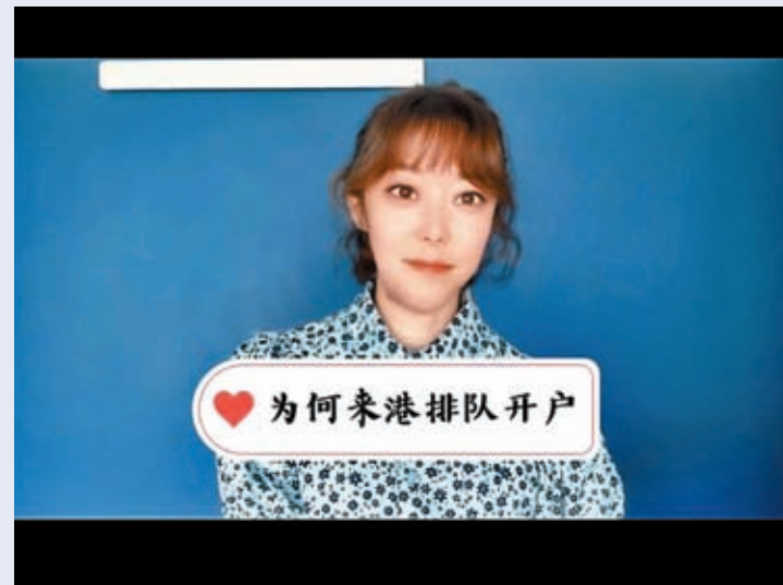
◆內地社交平台小紅書上，有大批網民「教路」如何赴港開戶，可見內地居民去香港開戶的火熱。