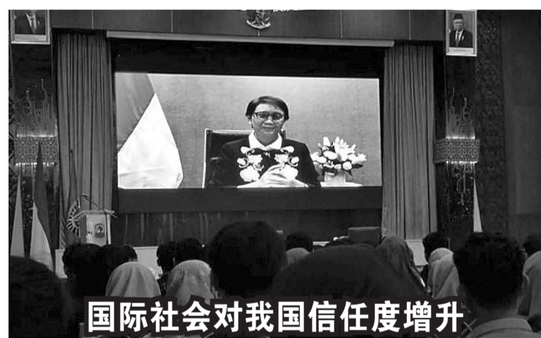
8 月 21 日，外交部长蕾特诺 (Retno Marsudi) 声称，如今国际社会对我国的信任度持续上升。

外，从越南的大米进口量则占 46.33%。 包括特种大米在内的各种大米进口量共 133 万吨，从越南、泰国及印度在 2023 年 1 月至 7 月前的大米进口价值共 7.159 亿美元。 据了解，商品编号为 HS10064090 的碎米，在今年 7 月份进口量增升 52.24%，而今年首 7 月累计的进口量比去年同期增长 3.46%。阿玛莉亚说：“如果根据价值计算，我们在 7 月份进口的碎米下跌了 4.34%，然而如果从累计的进口碎米价值平均上涨了 19.84%。”(Ing)