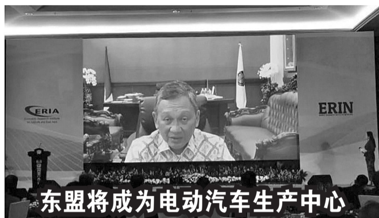
8 月 21 日，能源部长阿里芬 (Arifin Tasrif) 强调，东盟国家将成为电动汽车生产中心。

筹备项目已完成 63.09%。 据悉，我国总统府办公楼建设进度达 15.03%，国家宫及仪式广场建设进度达 13.97%，以及国务秘书处大楼建设进度达 8.89%。 还有新国都公路工程项目中，西侧轴心国道建设已实现 26.27%。新国都 Kariangau-Sp.Tempadung 3B 段高速公路建设进度达 24.55%。 民房公司也赢得前往新国都清真寺及物流码头的通道建设项目合同，工程价值共 397 万亿盾。这些新合同完成了该公司直至今年 6 月底获得共达 11.62 万亿盾的新合同价值总额。(Ing)