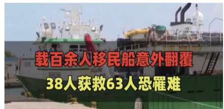
載百余人移民船意外翻覆 38人獲救63人恐罹難

3.日前，多米尼加首都一商業中心發生大規模爆炸，已致27死59傷，將舉行全國哀悼。