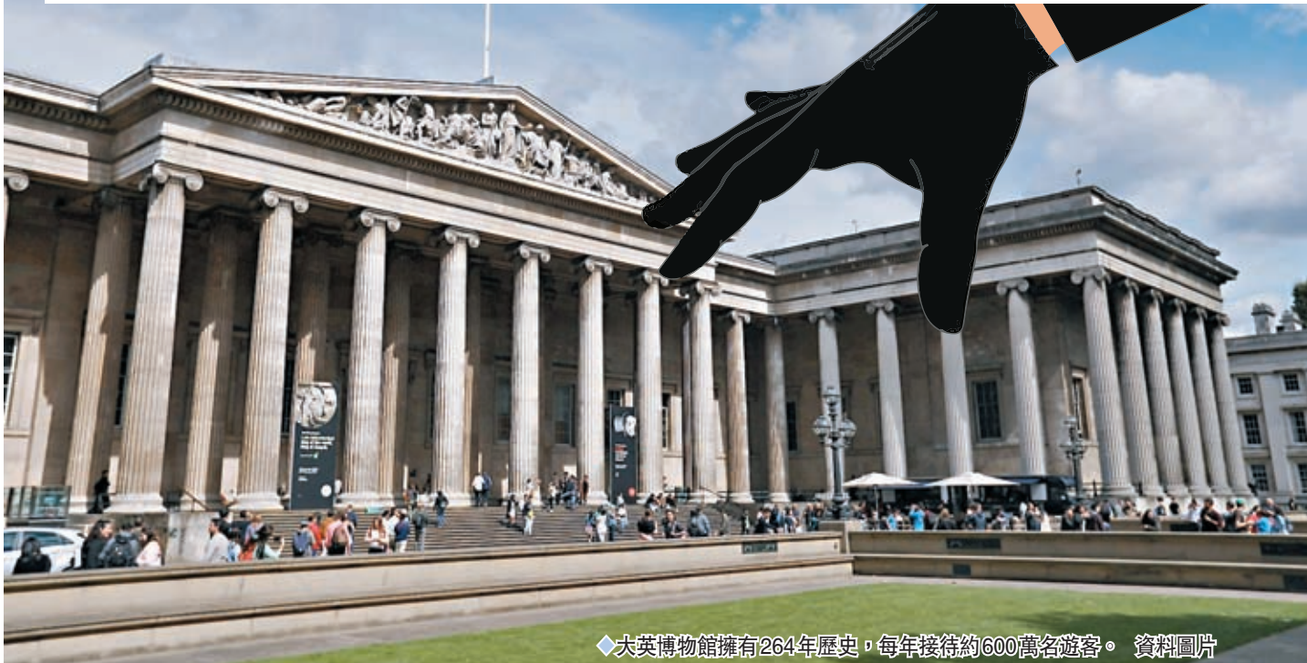
大英博物館擁有264年歷史，每年接待約600萬名遊客。資料圖片