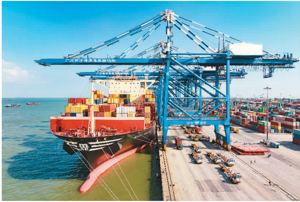
广州南沙港是粤港澳大湾区的重要航运枢纽。图为繁忙的南沙港。

人流之外，物流、信息流、资金流也在加速流动。广州南沙是全国最早开始跨境电商贸易试点的地区之一，广州海关针对跨境电商发展需求，通过自贸试验区与综合保税区政策叠加，打造“1+N”保税监管模式、“跨境电商出口退货监管新模式”、粤港澳大湾区机场共享国际货运中心等支持举措，推动南沙形成跨境电商产业集聚区，吸引160余家电商平台落户。