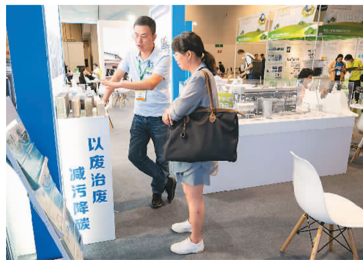
图为与会者在展会上洽谈。

作为国际展览业协会认证的专业展会，澳门国际环保合作发展论坛及展览今年踏入第十五届，展期也由过往的3天延长至4天。