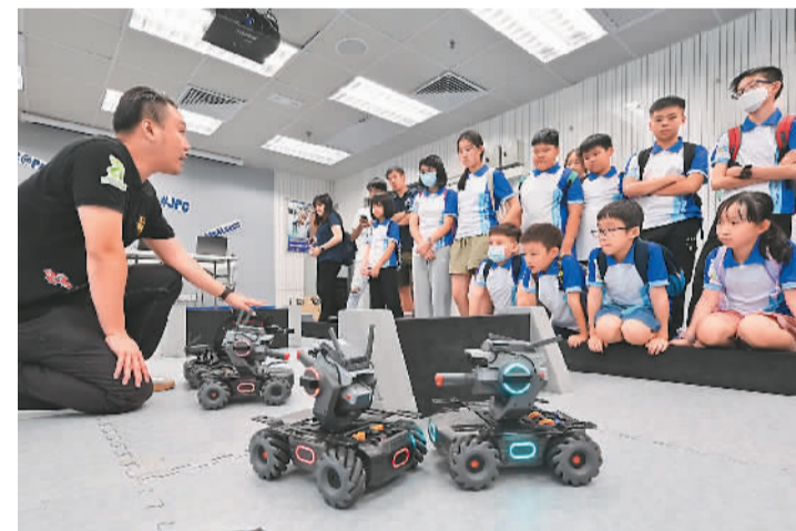
少年警讯会员在训练营中学习操作机器人。

实现中华民族伟大复兴而努力。据介绍，少年警讯夏令营透过多元化训练鼓励青少年走出舒适圈，提升他们的韧性、团队精神和领导才能，建立自信及正向价值观。本次夏令营为超过300名少年警讯会员安排多个日营及两日一夜的训练营，活动包括培养青少年国家意识的中式升旗和步操练习、宣传防罪信息的解密解密活动“解密型警”以及闪避球比赛等。