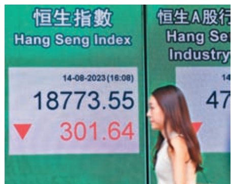
◆港股失守19,000點大關，14日一度瀉520點，成交額1,042億港元。 中通社

ATM等重磅科技股同告下跌，但尾市大幅回穩支撐起大市，本周公布業績的騰訊僅跌0.8%，阿里巴巴跌2.6%，美團跌1.3%。全日科指跌幅收窄至1.5%，報4,208點。多隻電動車型宣布減價，汽車股也有沽壓，比亞迪跌6.2%，「蔚小理」三車股亦跌2.7%至3.2%；東風發盈警，料上半年純利倒退75%至80%，股價大插7.2%。