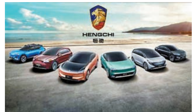
◆迪拜車企將以約39億港元，入股恒大汽車27.5%。

恒大汽車14日逆市升14.1%，收報1.7港元。紐頓集團14日美股盤初一度漲5.1%，但開盤後一個半小時僅成交不足3萬股。