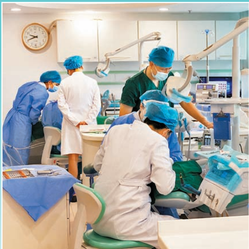
◆南方醫科大學深圳口腔醫院（坪山）口腔舒適化治療室。