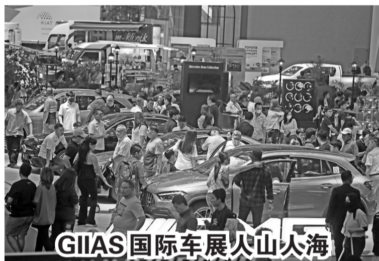
8月12日,印尼机动车工业联合会国际车展(GIAS)在万丹省丹格朗县瑟榜召开,约有数千人前来观展。

甚至我国和经济合作与发展组织已经开展了许多的合作项目,比如经济调查以及对印尼政策的评估等。 除此之外,我国也对与国企和税收、资本流动、政府采购、反贪污和环境等有关的政策进行评估。 关于我国想加入成为经济合作与发展组织成员,佐科维总统希望加入过程能够迅速并良好进行,并也能够有助于改善我国的官僚体系和政策素质。还有,印尼为加强经济发展,也已经进行了很多改革,这些改革步骤显然符合了,要加入经济合作与发展组织作为成员的要求。 穆丽亚妮补充说:“我国想加入经济合作与发展组织并非从零开始,我国已对许多领域进行了改革,这些改革步骤也同经济合作与发展组织的政策框架需求相符。”(Sm)