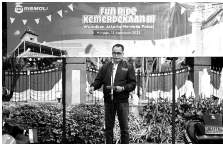
交长冀民众使用电动车以降低空气污染 图示:交通部长苏马迪(Budi Karya Sumadi)于8月13日在雅加达出席印尼电动摩托车工业协会举办的“有趣骑行”活动中发表讲话,他呼吁民众转为使用电动车,以降低我国各地空气污染的现象。