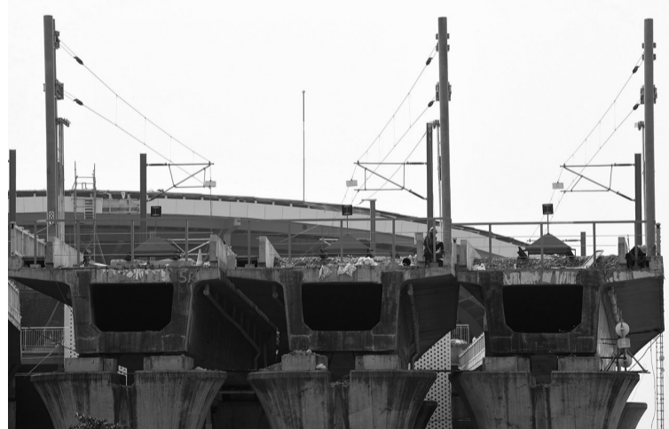
哈林高铁站施工进度达97.3% 8月12日,印尼高铁公司声称,雅万高铁哈林站的施工进度已经达到97.32%,并预定今年8月底竣工并开始投运。