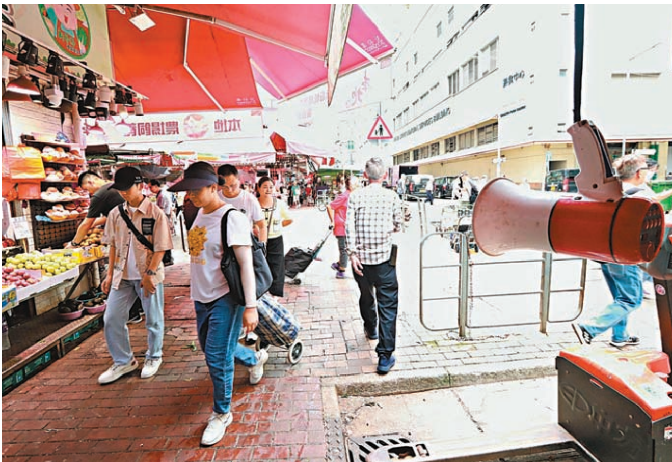
北河街街市不少商戶以預錄聲音用揚聲器叫賣。