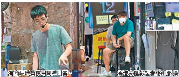
商戶職員使用喇叭叫賣。