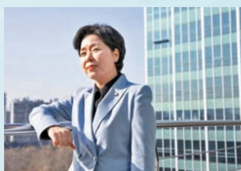
◆ 梁香子促美放棄圍堵中國的芯片戰略。

香港文匯報訊 韓國國會議員、前芯片工程師及科企巨擘三星前高管梁香子，日前接受英國《金融時報》訪問時，敦促美國放棄圍堵中國的芯片戰略。梁香子強調，美國限制中國獲取或生產先進芯片能力的措施，反而讓盟友擔憂此舉或加劇中美對抗，擾亂半導體供應鏈並威脅企業利潤，長遠損害美國與亞洲盟友的關係。