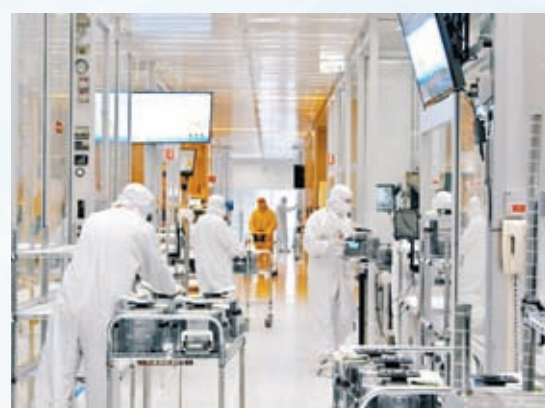
◆ 芯片製造商SkyWater因無法確認補貼數額而未能建廠。 網上圖片

香港文匯報訊 美國總統拜登簽署《芯片與科學法案》已有一年，然而該法案承諾的527億美元撥款至今仍未撥出分毫。美國半導體業界代表紛紛表示，至今尚未拿到聯邦政府補貼，若沒有政府承諾的協助，企業不論是新建工廠、投資技術還是招募人手，都面臨相當沉重的成本負擔。