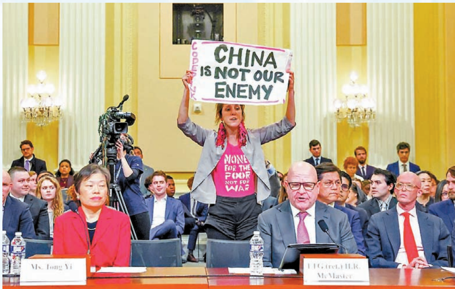
◆ 美國圍堵中國的做法，連美國人都不買賬，今年2月有示威者闖入國會聽證會進行抗議。

美國商務部長雷蒙多據此表示，商務部現時收到合共460間公司的申請，撥款會在今年稍後開始。不過有商務部官員披露，該部門已聘請官員審核各項補貼申請，在如何分配資金方面，當局將面臨艱難選擇，並不是每個申請人都會滿意，有些人會感到失望。