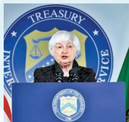
◆ 耶倫指限制令不會傷害對華投資環境。