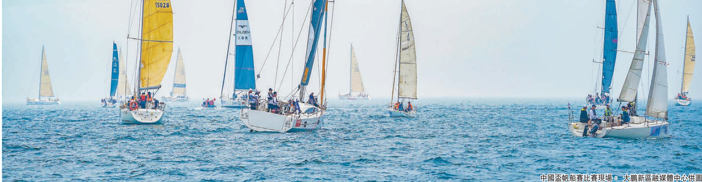
中國盃帆船賽比賽現場。